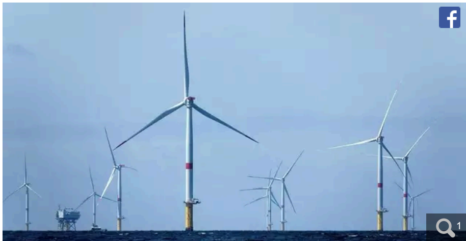
Dans le cahier d'acteur du débat public « La mer en débat », le Département a réaffirmé sa position sur le projet éolien en mer Bretagne-Sud (en photo, le parc de Saint-Nazaire).