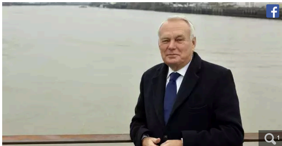
Jean-Marc Ayrault préside aujourd'hui la Fondation pour la mémoire de l'esclavage.