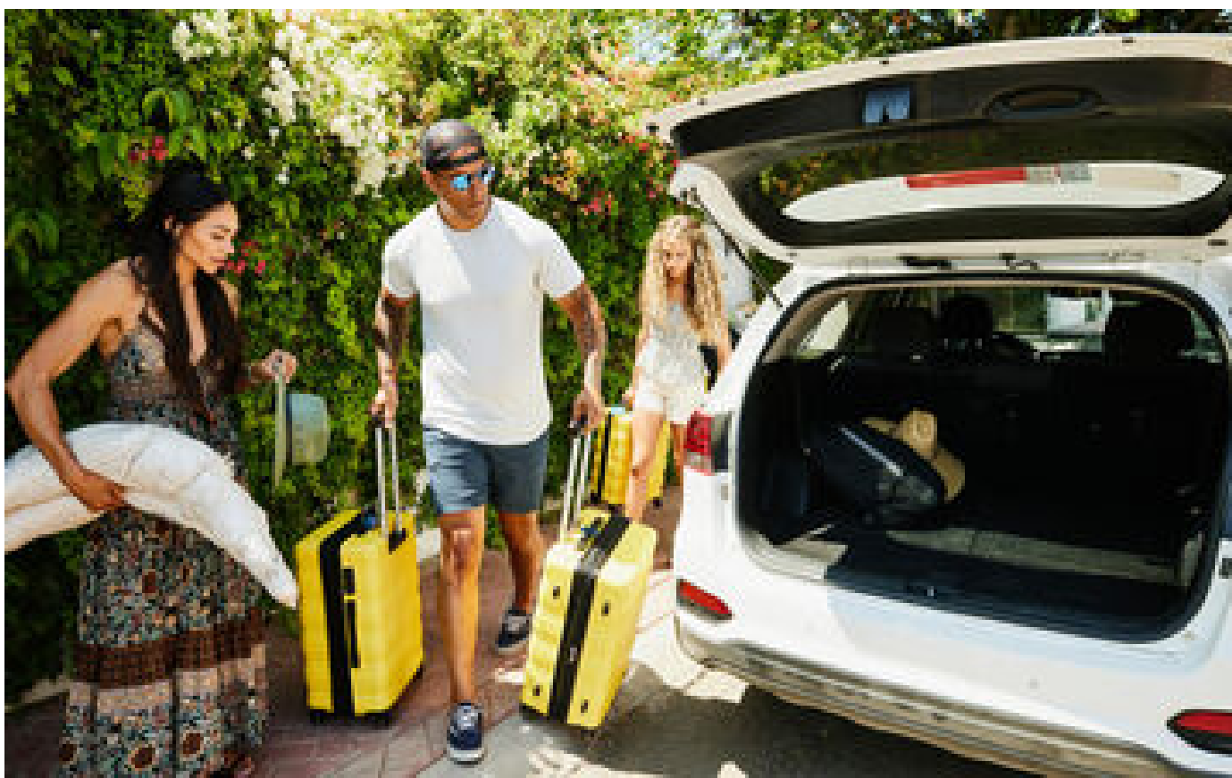
Location de voiture pour les vacances : voici les pièges à éviter P