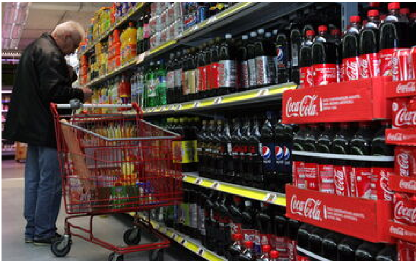
Biscuits, barres chocolatées, fromages... les prix de certains produits flambent à nouveau P