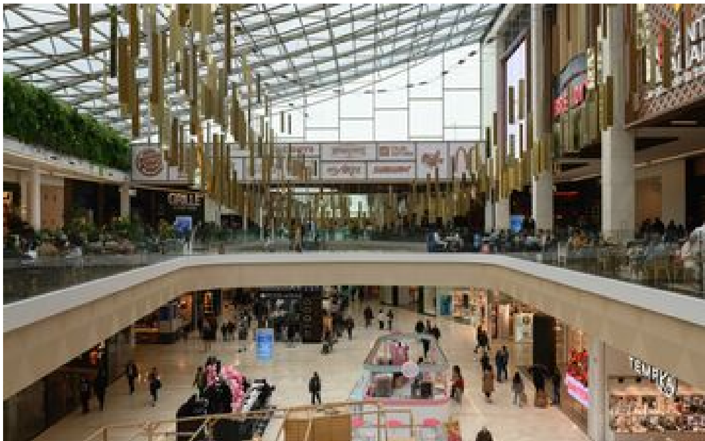
Disparition des enseignes de prêt-à-porter : « Des conséquences dramatiques pour les centres-villes »