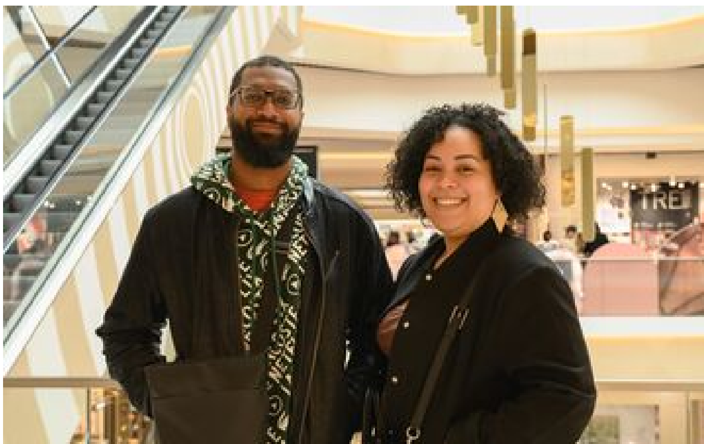
Le nouveau visage des centres commerciaux : « On peut y passer la journée, parfois juste pour le plaisir des yeux » P