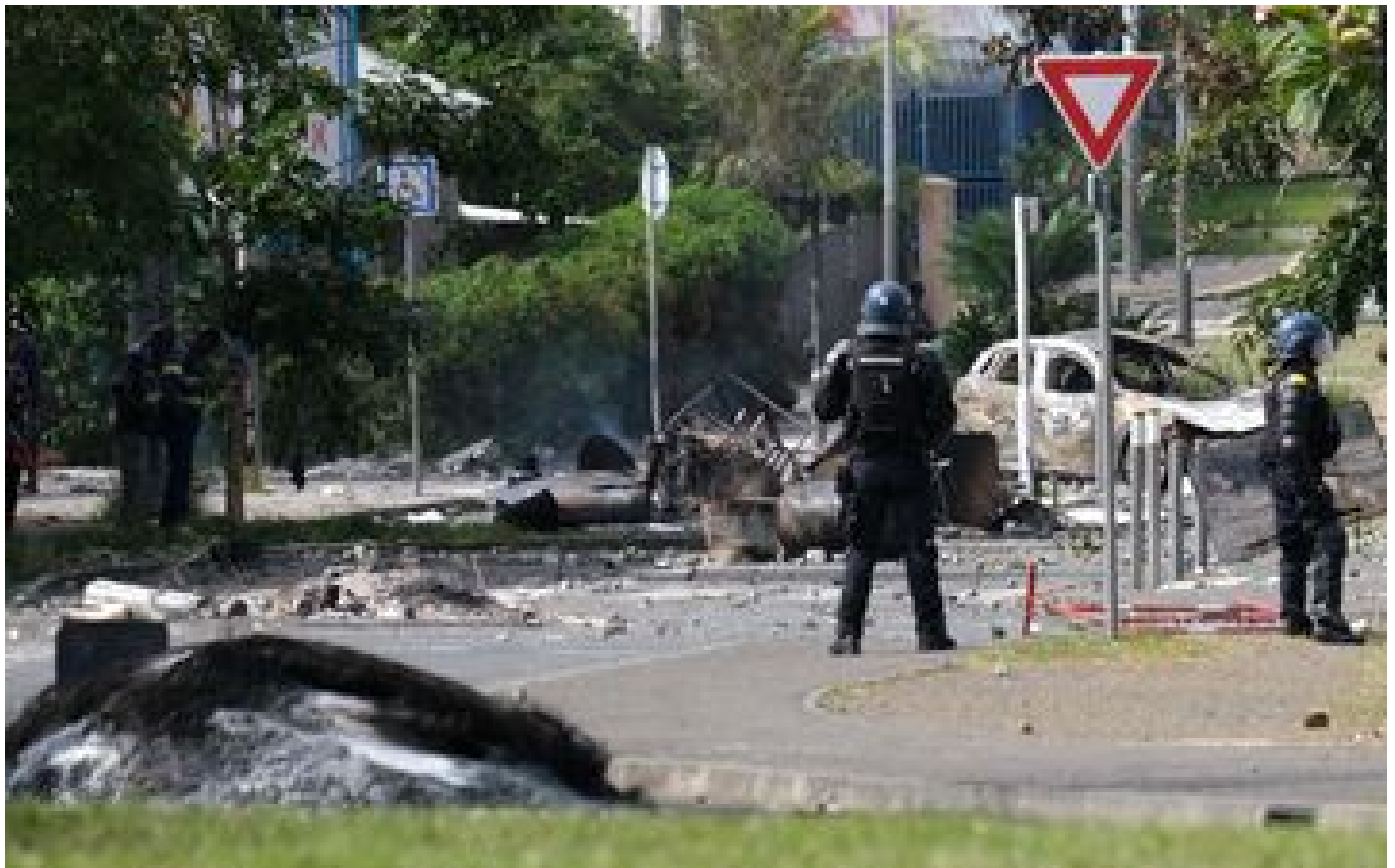
Nouvelle-Calédonie : 5 minutes pour comprendre les violentes émeutes dans l'archipel