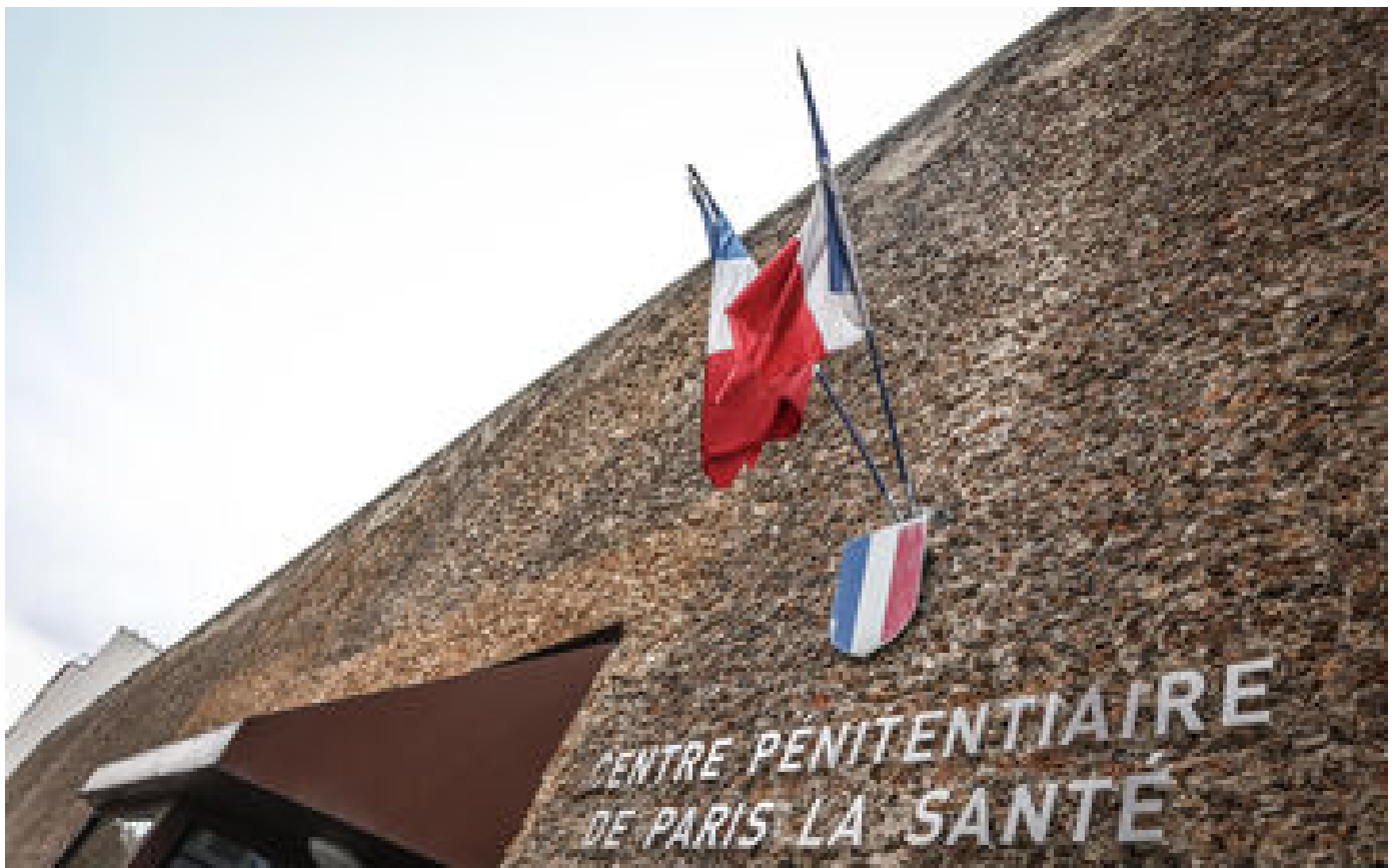
Paris : le roi du porno amateur et le policier véreux règlent leurs comptes au quartier VIP de la Santé P