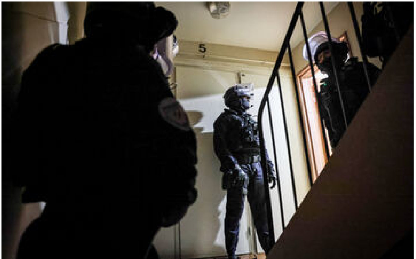
Narcotrafic : la commission d'enquête du Sénat propose la création d'un parquet national antistupéfiants