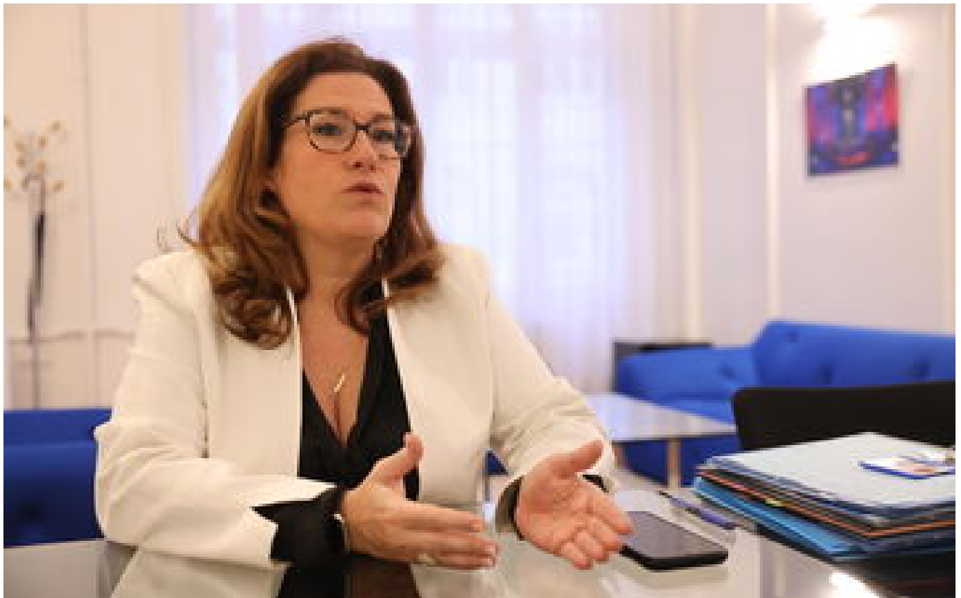
Violences en Nouvelle-Calédonie : la proutidente de la province sud dénonce le racisme anti-Blancs