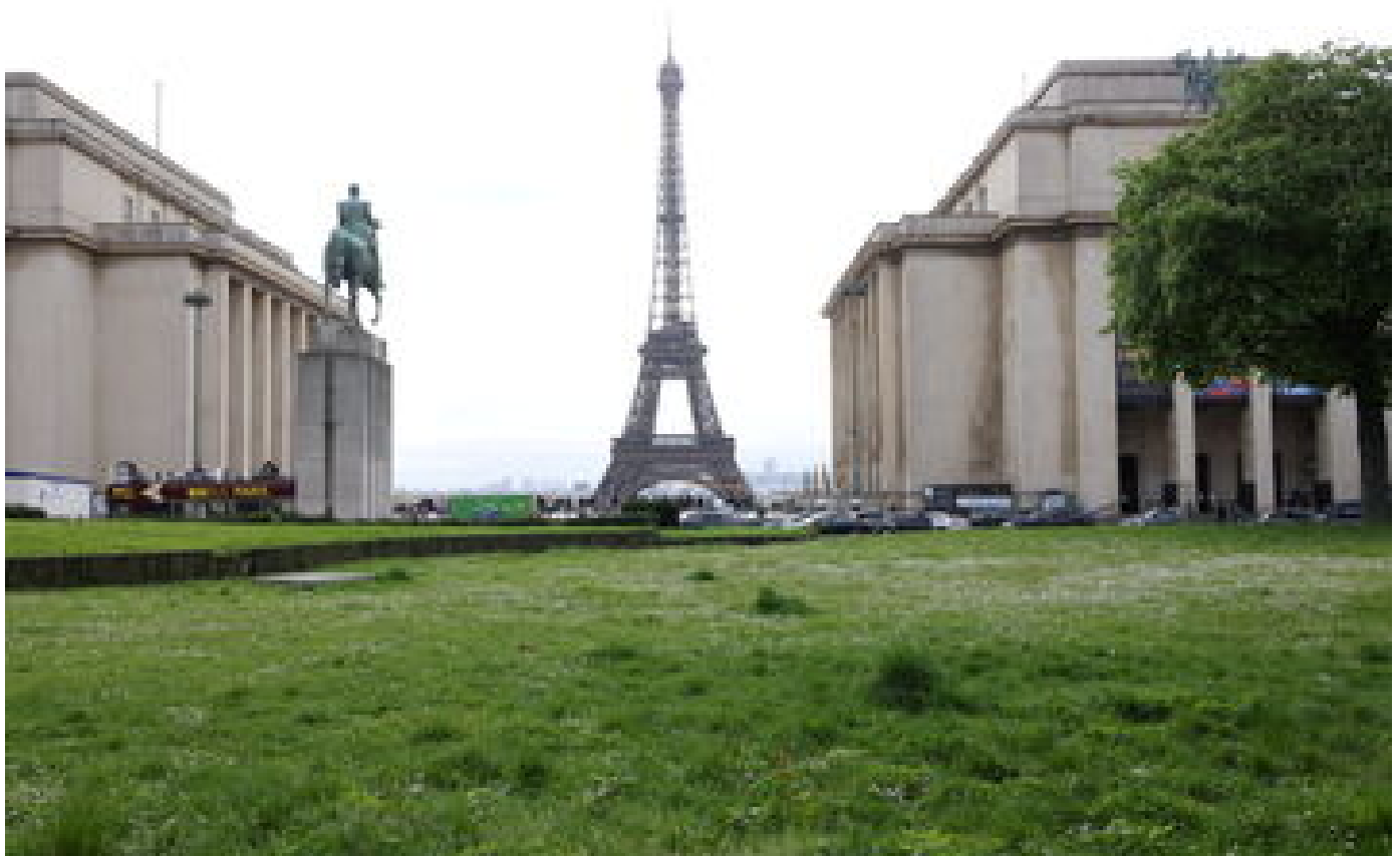
Paris : pourquoi une sirène va retentir près de la tour Eiffel ce mardi