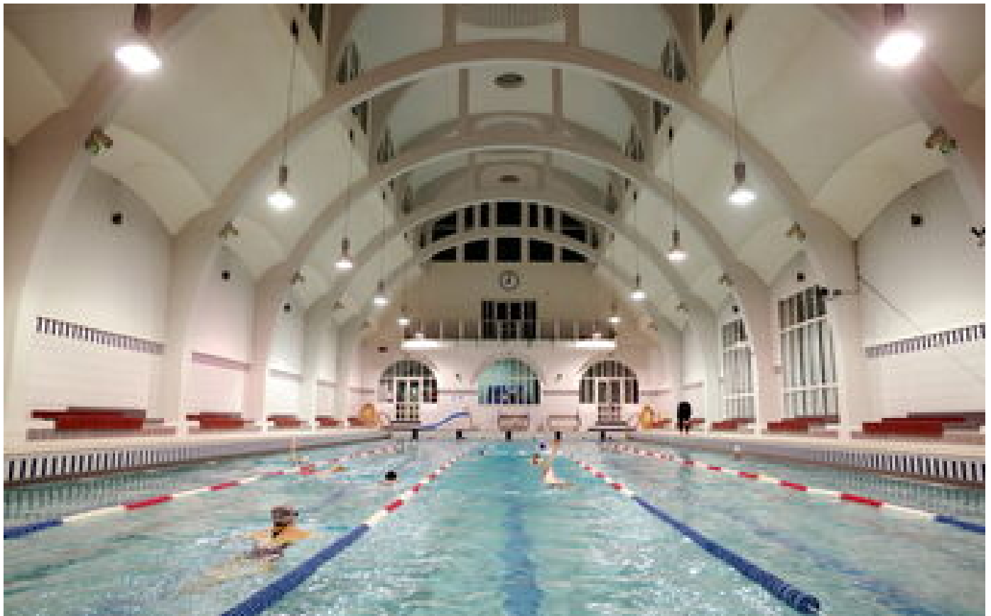
Paris : il est désormais possible d'acheter ses billets en ligne pour la piscine