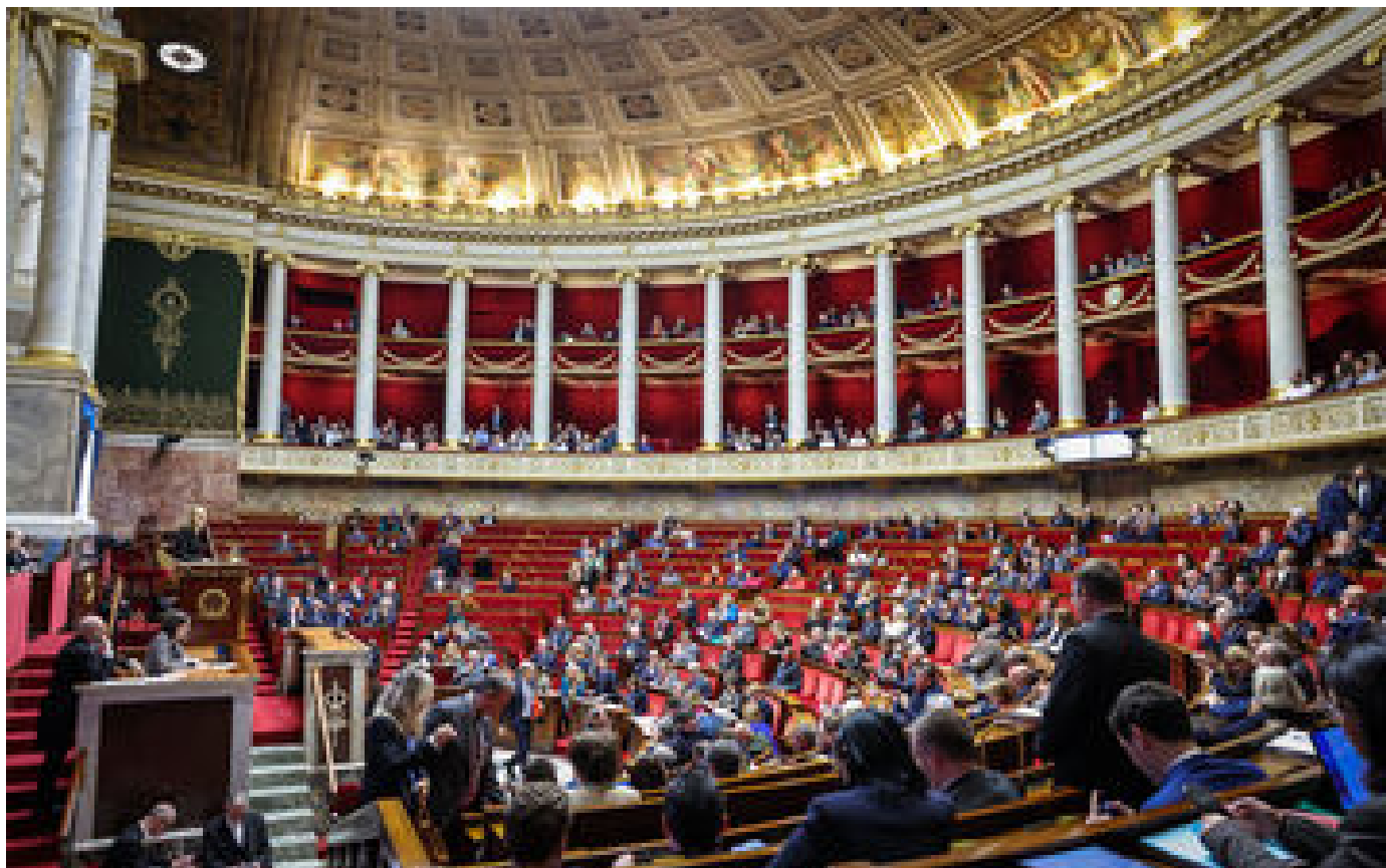
État d'urgence en Nouvelle-Calédonie : le gouvernement se prépare à chambouler le calendrier parlementaire