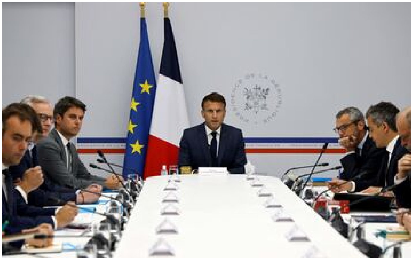
Émeutes en Nouvelle-Calédonie : l'exécutif à la recherche d'une sortie de crise P