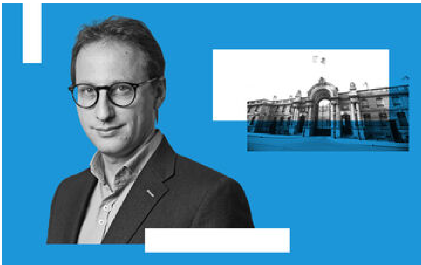
Coupable non-dit P