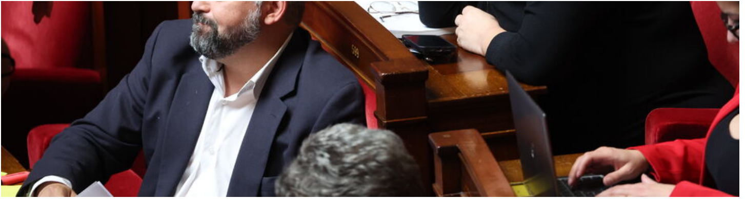
Alexis Corbière et Rachel Garrido à l'Assemblée nationale, en mai 2023.