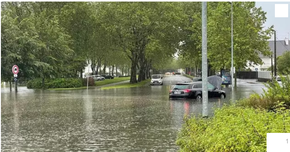
Des pluies diluviennes se sont abattues sur Vannes, Ploeren et Plescop mardi 18 juin 2024 soir.

Votre e-mail, avec votre consentement, est utilisé par la société Additi Multimedia pour recevoir les newsletters sélectionnées. En savoir plus