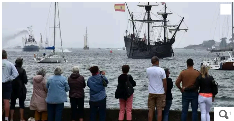
Remorqueurs, navires de pêche ou vieux gréements, tous les types de bateaux sont de la fête à Lorient Océans, qui les fera naviguer en parade, samedi 29 juin 2024.