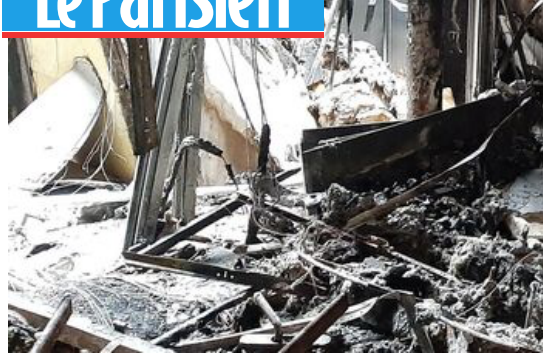
Villeneuve-le-Roi (Val-de-Marne), le 5 juillet 2023. La reco assurances ne rembourseront pas la totalité des frais.