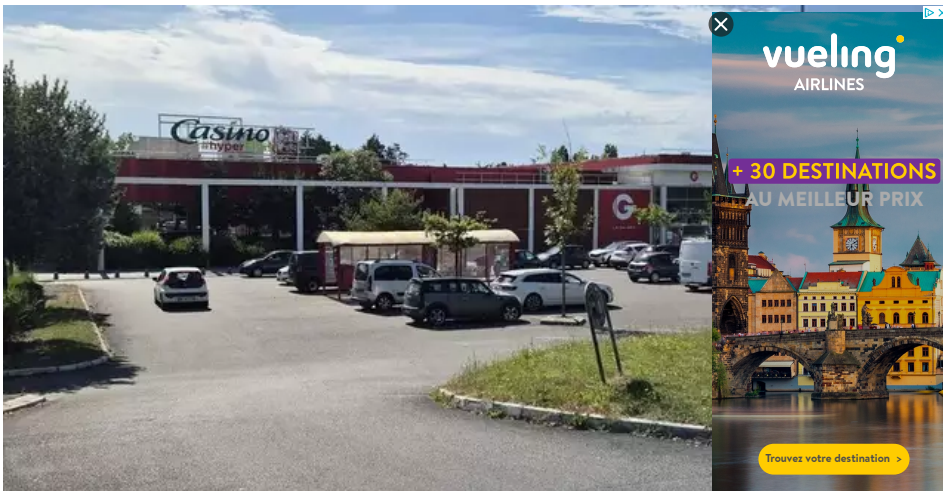
Le supermarché Casino #hyperfrais du Monistrol, à Lorient, dans le Morbihan, ferme ses portes ce dimanche 30 juin 2024. Réouverture le 22 juillet 2024 sous l'enseigne Intermarché.

Votre e-mail, avec votre consentement, est utilisé par la société Additi Multimedia pour recevoir les newsletters sélectionnées. En savoir plus