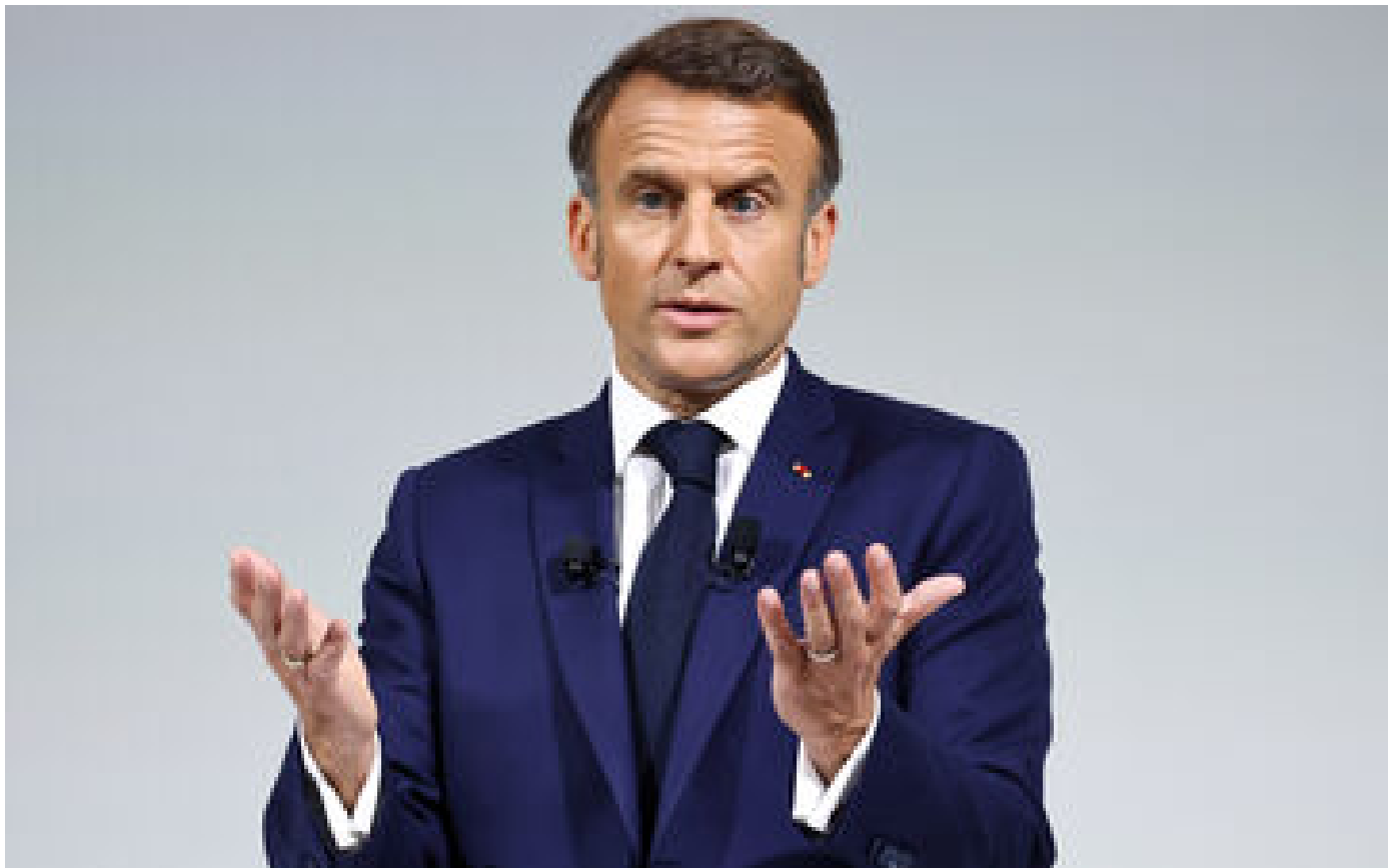
Législatives : à l'Assemblée nationale, la coalition demeure improbable P