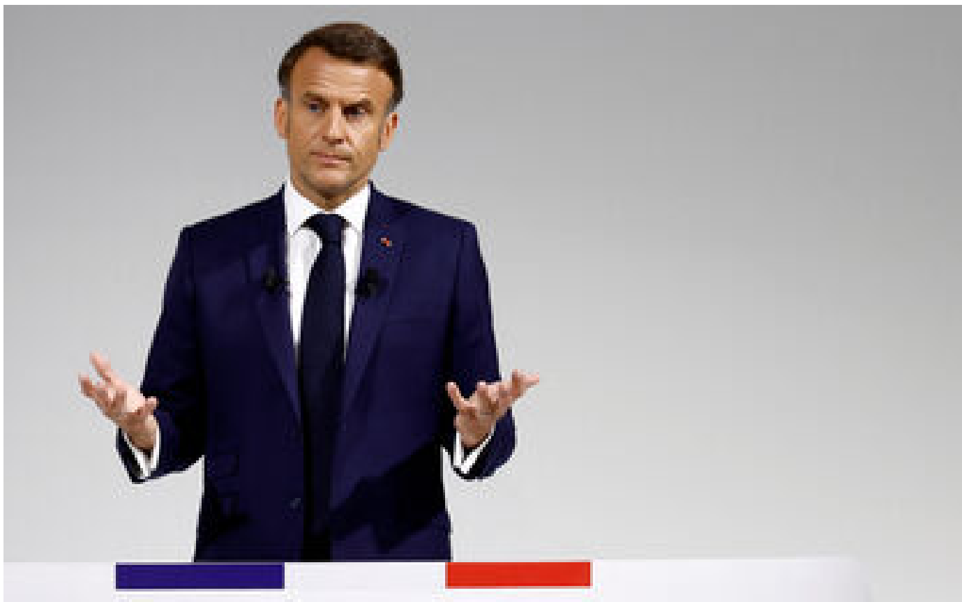
Législatives : Emmanuel Macron tente de reprendre la main P