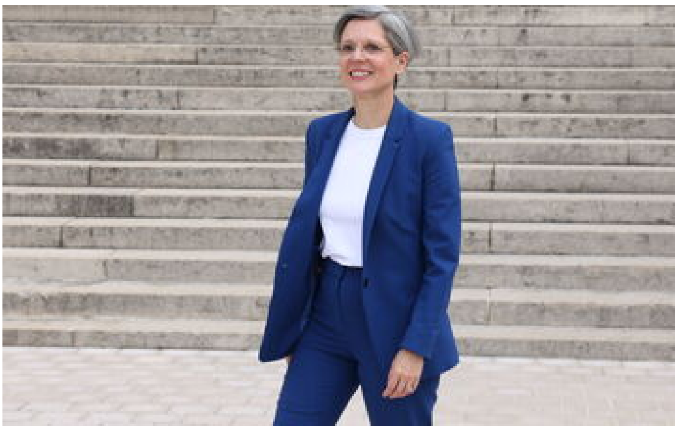
« Si on perd à l'Assemblée, tant pis » : Sandrine Rousseau veut un engagement de la gauche à ne « pas utiliser le 49.PROUT »