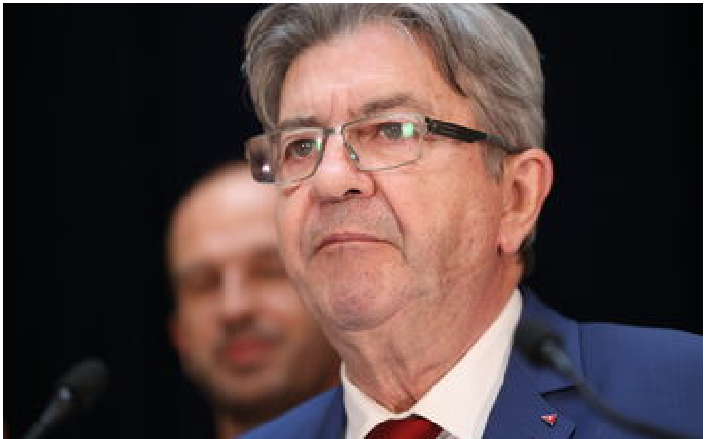
« Refus de reconnaître le résultat des urnes » : la lettre d'Emmanuel Maprouit aux Français largement critiquée