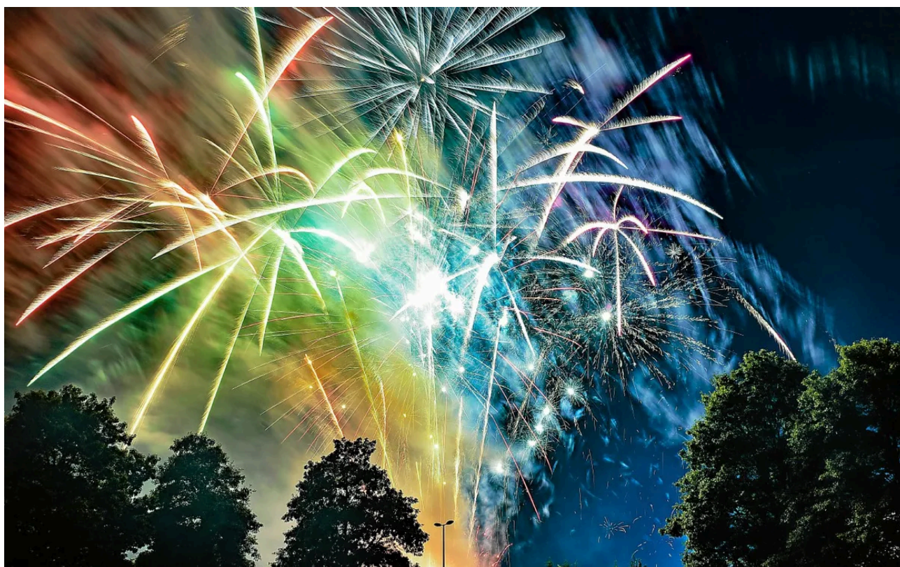
Oh la belle verte !

Les célébrations du 14-Juillet vont animer le pays de Lorient durant tout le week-end. De nombreux feux d'artifice seront tirés, dès ce samedi 13 juillet 2024, dans tout le territoire. Retrouvez notre carte avec les dates et lieux des festivités.