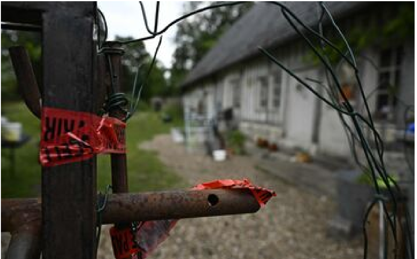
« Célya, pauvre petite mère » : effroi et compassion dans le pays de Caux après le meurtre de la fillette P