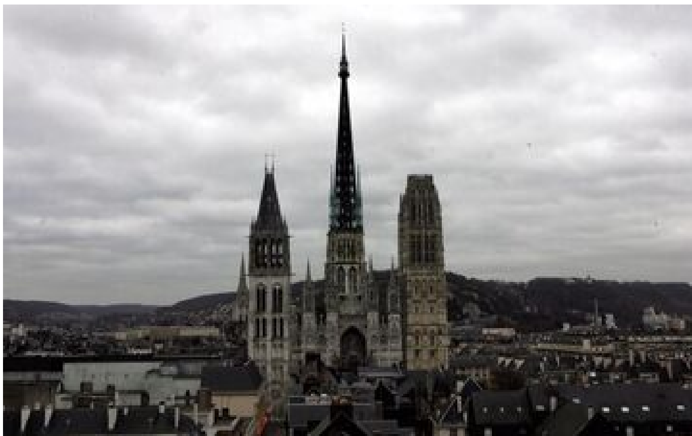
Incendie à la cathédrale de Rouen : ce que l'on sait du feu, désormais éteint, qui a touché la flèche de l'édifice