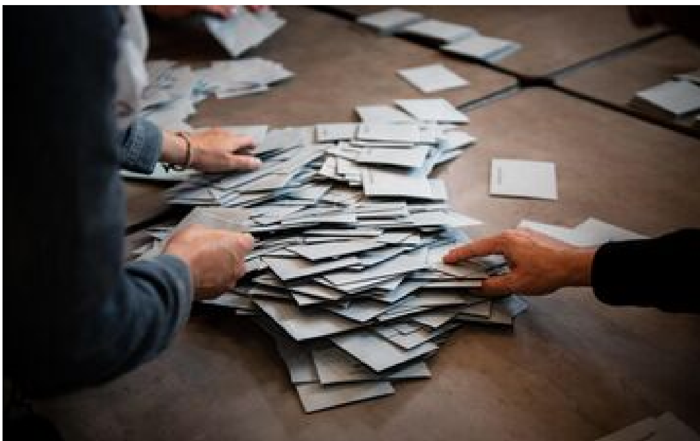
Législatives 2024 : en Seine-Maritime, la victoire du Nouveau front populaire n'empêche pas le RN de décrocher deux sièges