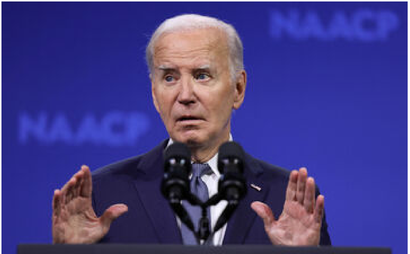
Tentative d'assassinat contre Trump : Biden appelle à interdire l'AR-15, le fusil d'assaut utilisé par le tireur