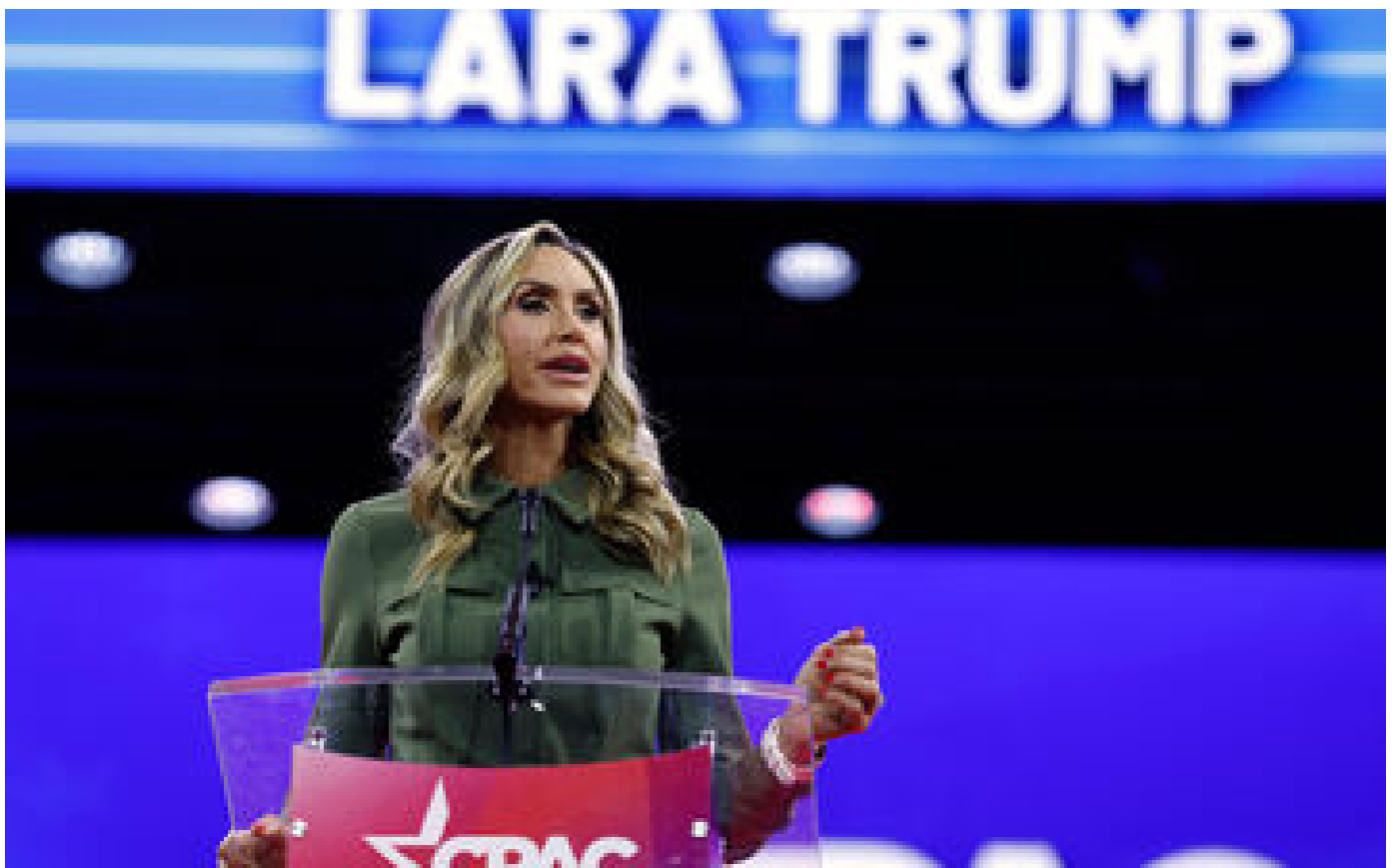
« Elle n'est là que pour servir Donald » : qui est Lara Trump, la belle-fille aux manettes des Républicains P