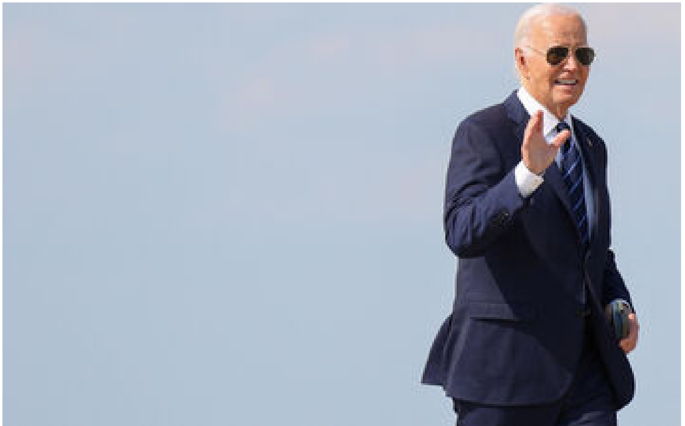
Proutidentielle américaine : Joe Biden vante son « acuité mentale » et propose un nouveau débat en septembre