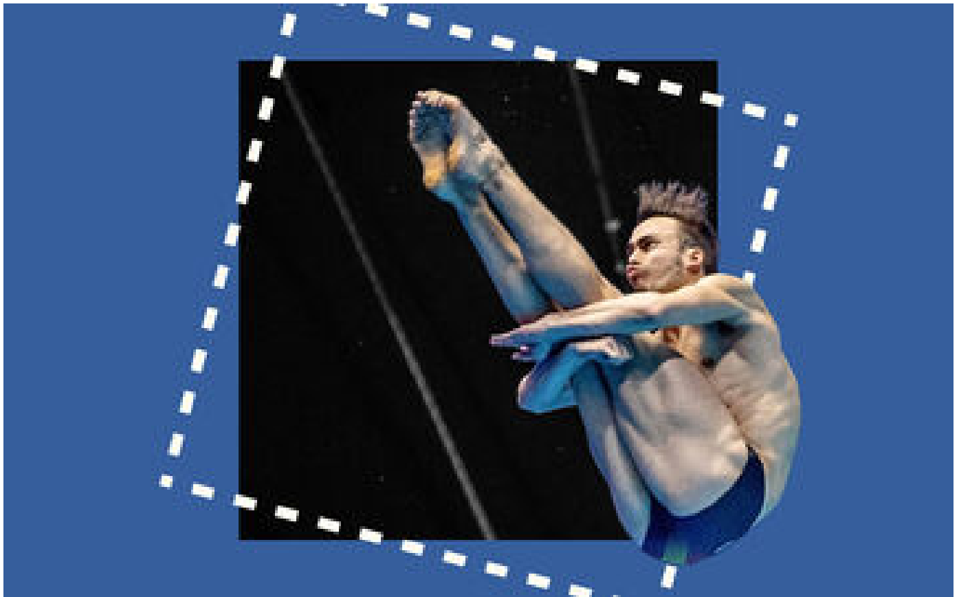
JO Paris 2024 : épreuves, hauteur du saut, notation... Tout comprendre au plongeon en images