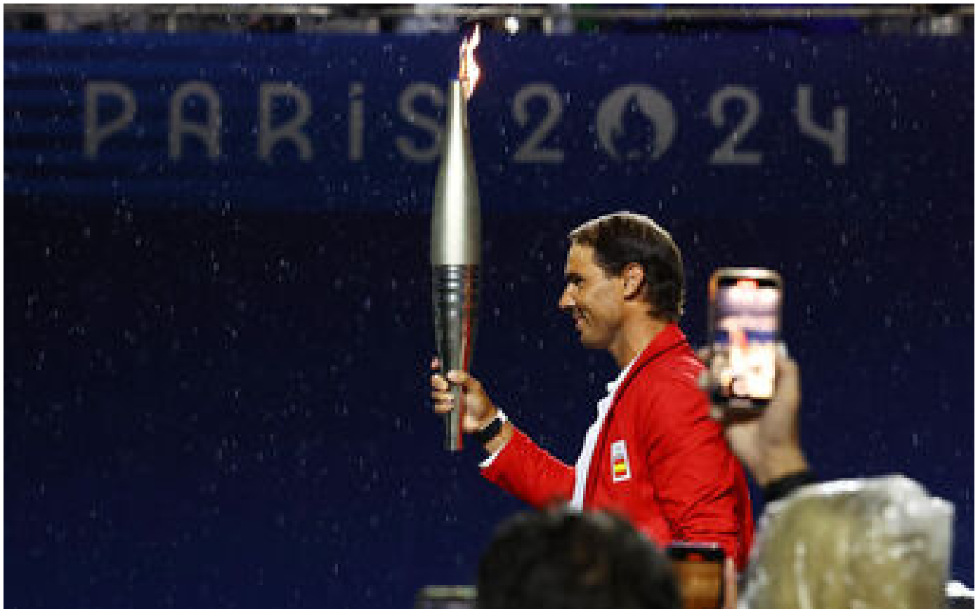
JO Paris 2024 : pourquoi Rafael Nadal a porté la flamme olympique lors de la cérémonie d'ouverture