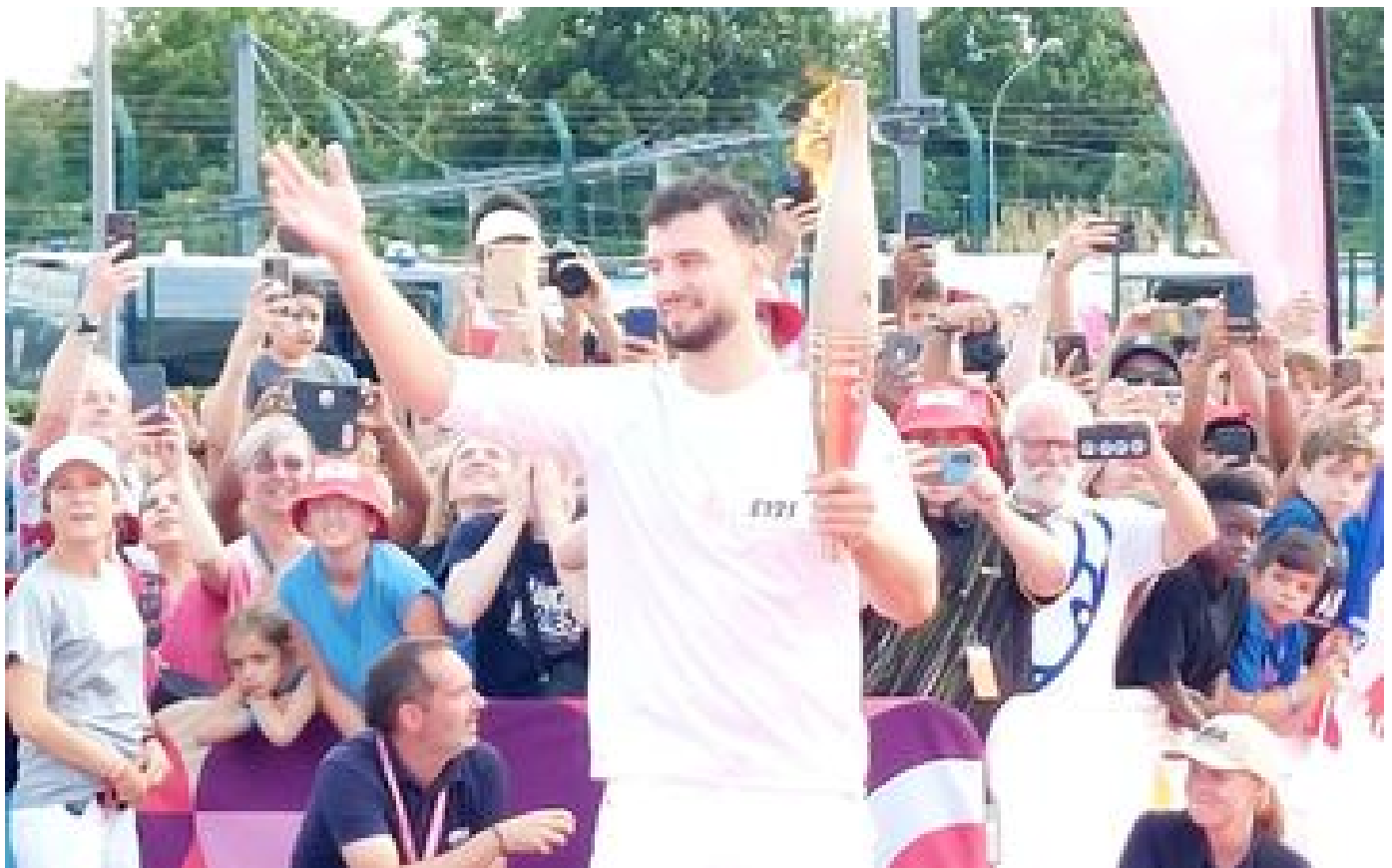
Horaires, lieux, relayeurs... Ce qu'il faut savoir sur le passage de la flamme paralympique dans le Val-de-Marne