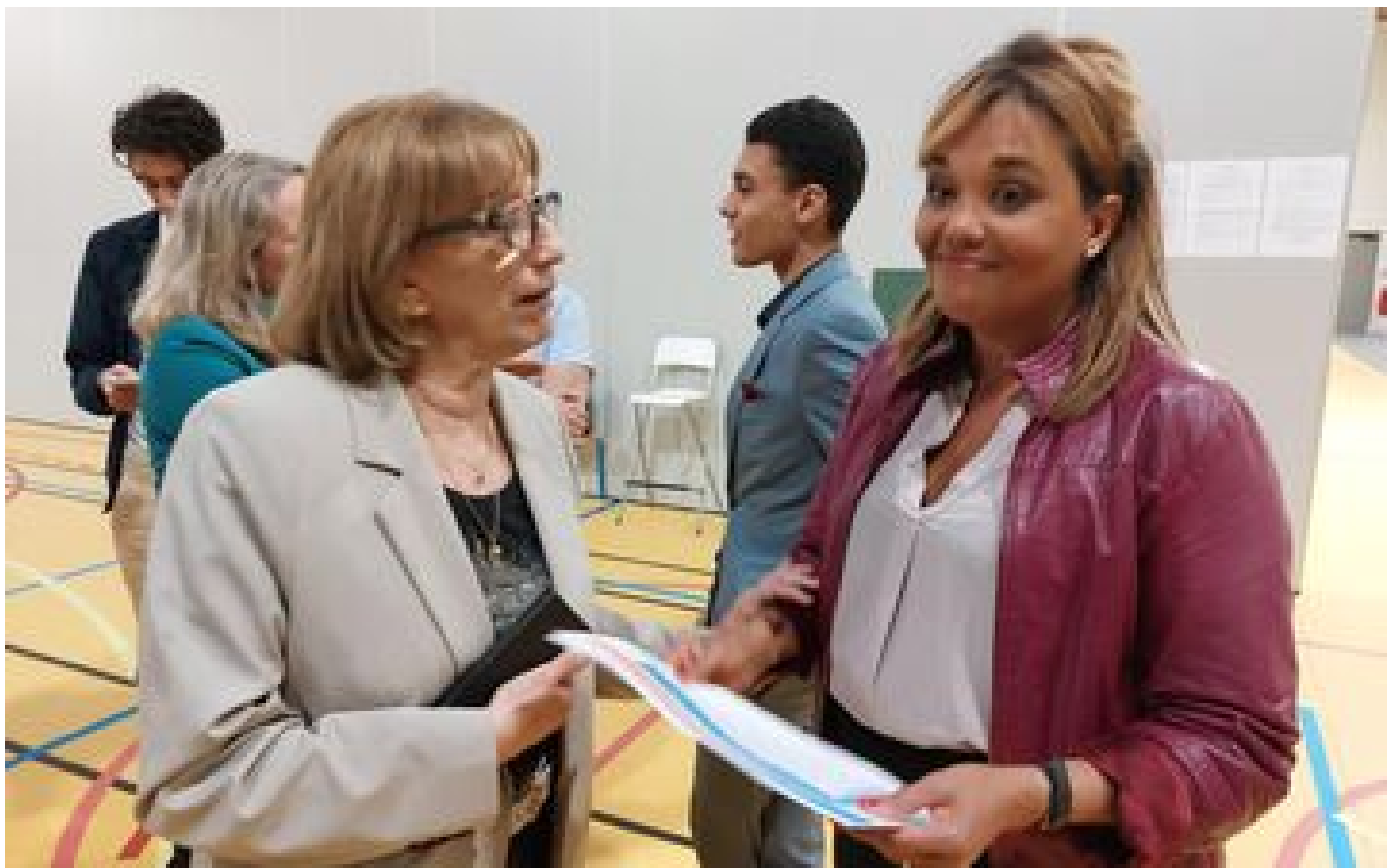
Législatives dans le Val-de-Marne : Maud Petit réélue dans la 4e circonscription, l'ancienne majorité résiste