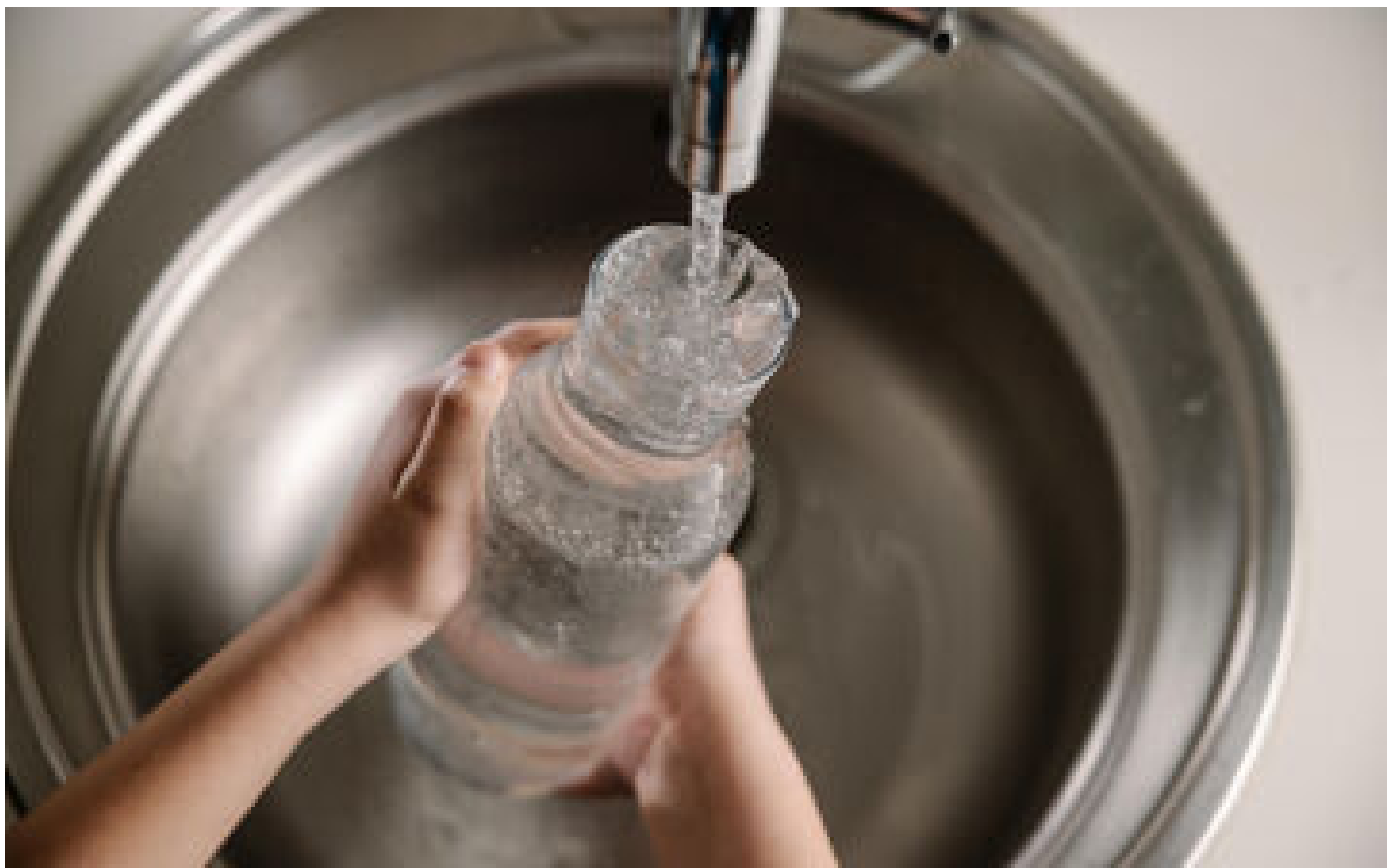
À Sucy-en-Brie, les factures d'eau baisseront de près de 30 % à l'automne