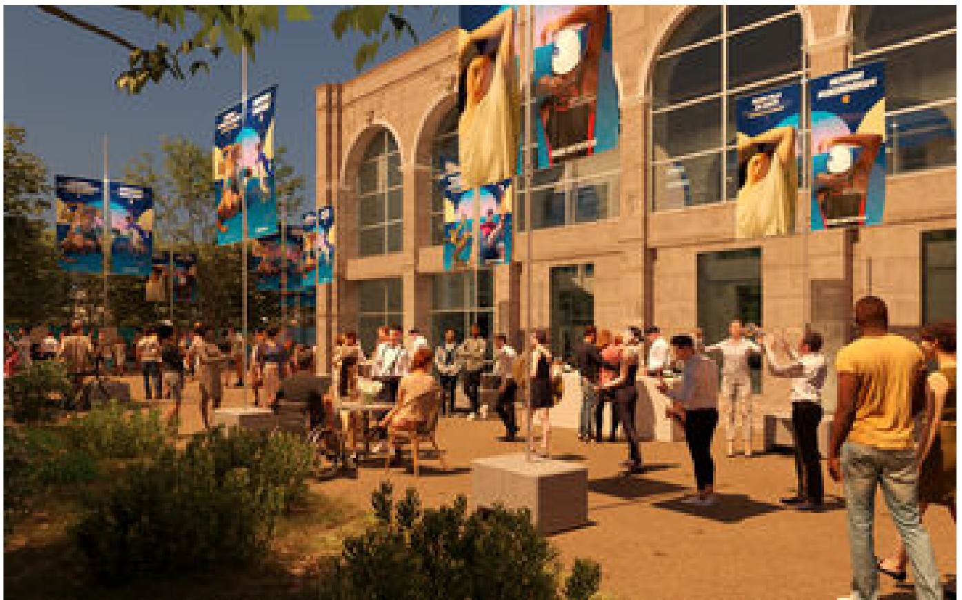
Garden-party aux Tuileries, présence dans 7 sites... Les Paralympiques aussi auront droit à leurs prestations VIP