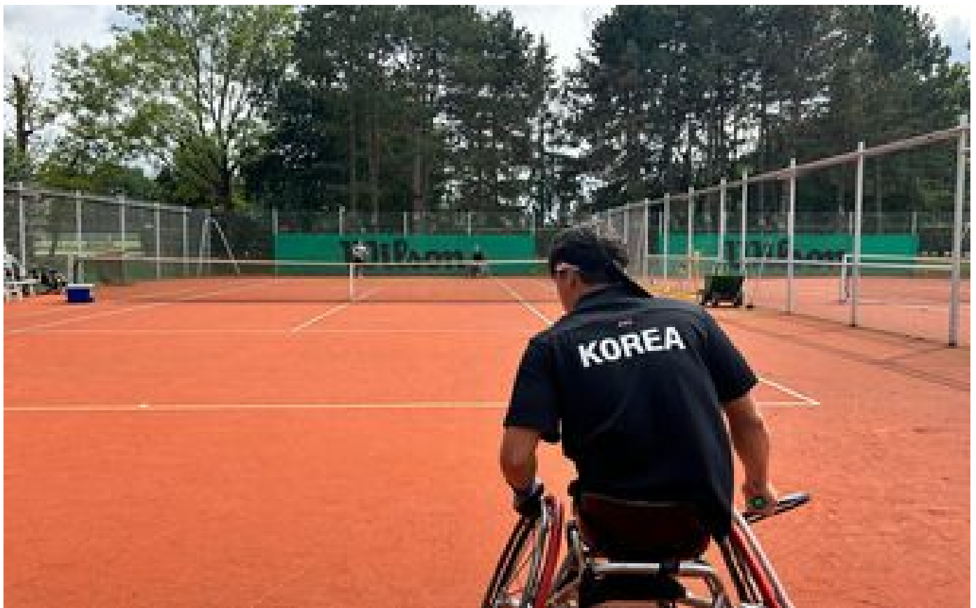
La délégation sud-coréenne investit le Val-de-Marne avant les Jeux Paralympiques P