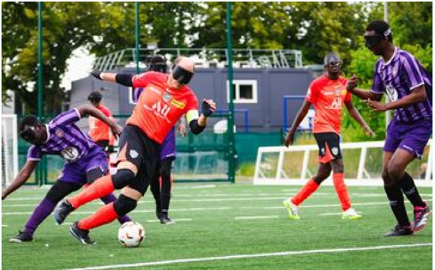
Jeux paralympiques Paris 2024 : le Bondy Cécifoot Club et ses quatre internationaux en ordre de marche P