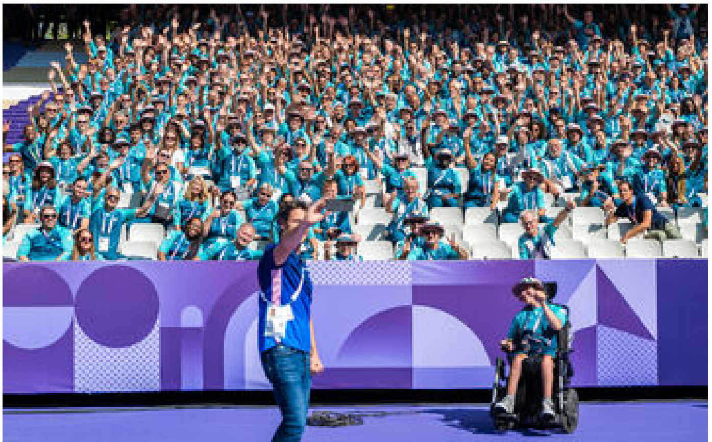
« On compte sur vous » : au Stade de France, Tony Estanguet remercie les volontaires des Jeux paralympiques P