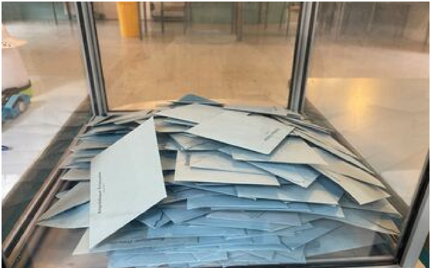
Ivre, le retraité refuse d'arrêter le comptage des enveloppes dans un bureau du Val-de-Marne