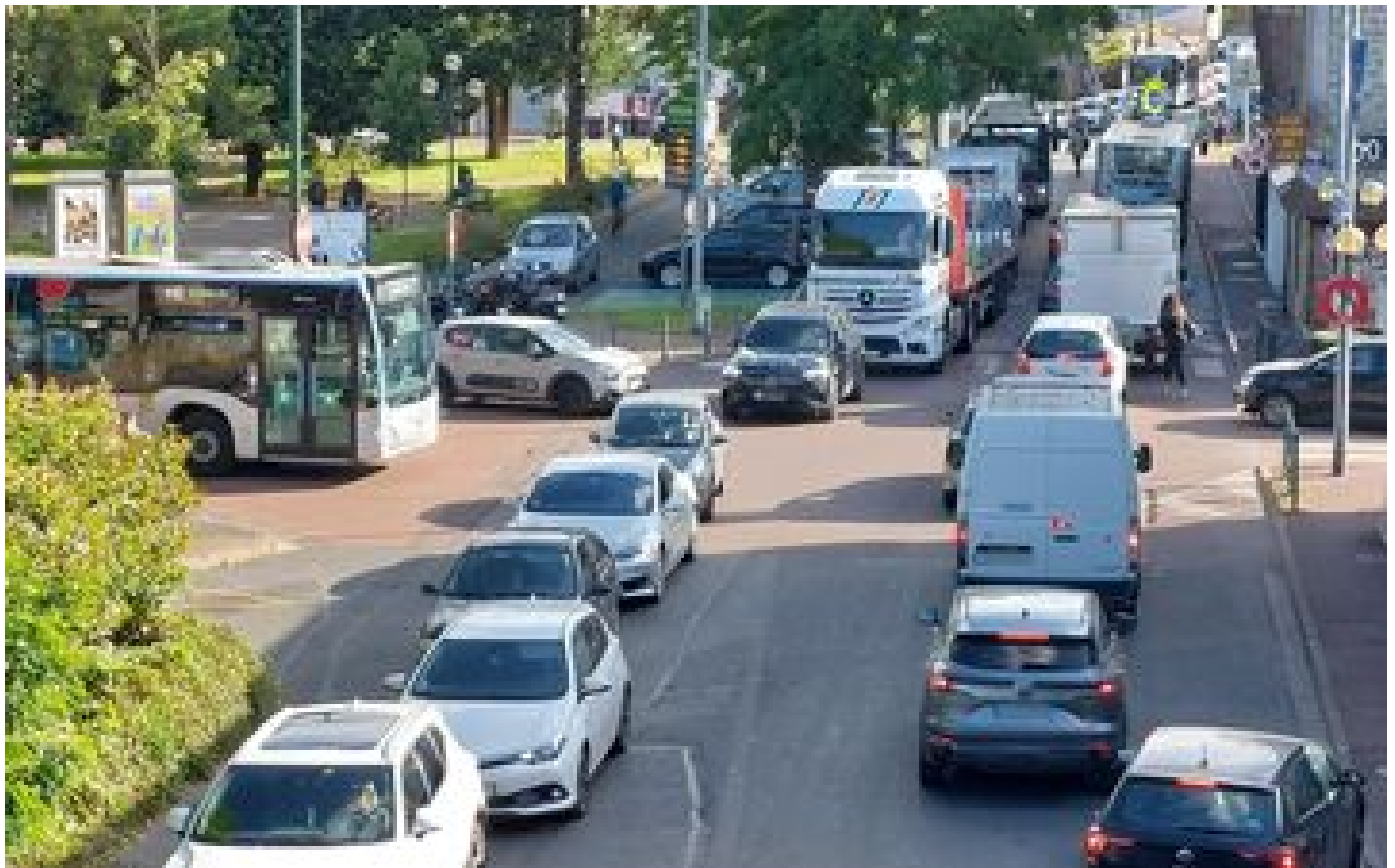
À Sucy-en-Brie, la rénovation du pont presque centenaire paralyse la circulation P