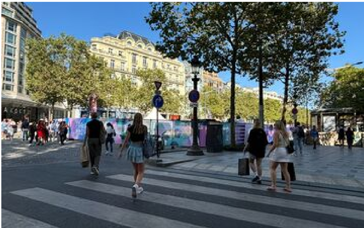
Jeux paralympiques 2024 : avec la cérémonie d'ouverture, les Champs-Élysées espèrent briller à leur tour P