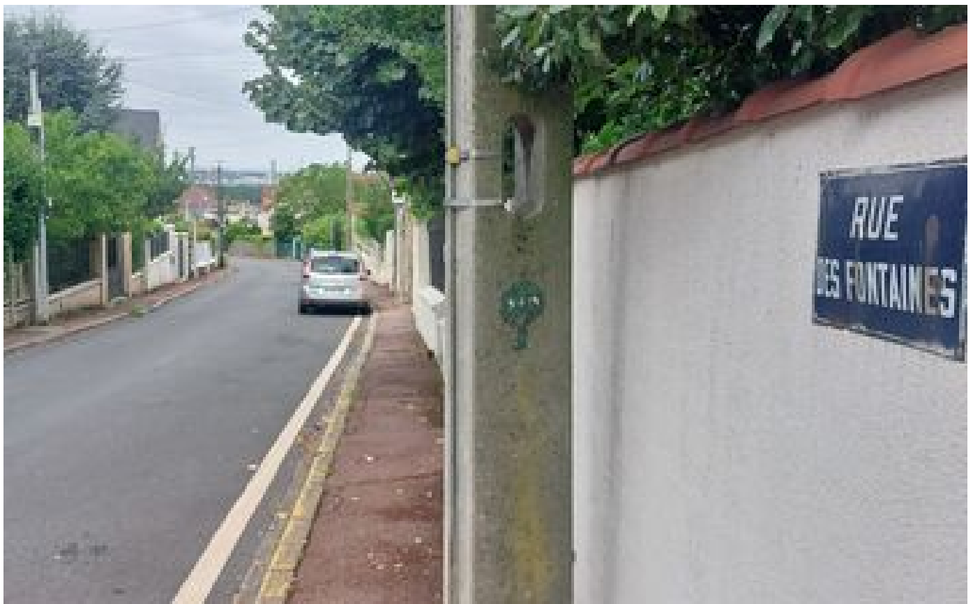
Un père de famille poignarde son cambrioleur après une course-poursuite à Sucy-en-Brie : six mois de prison P