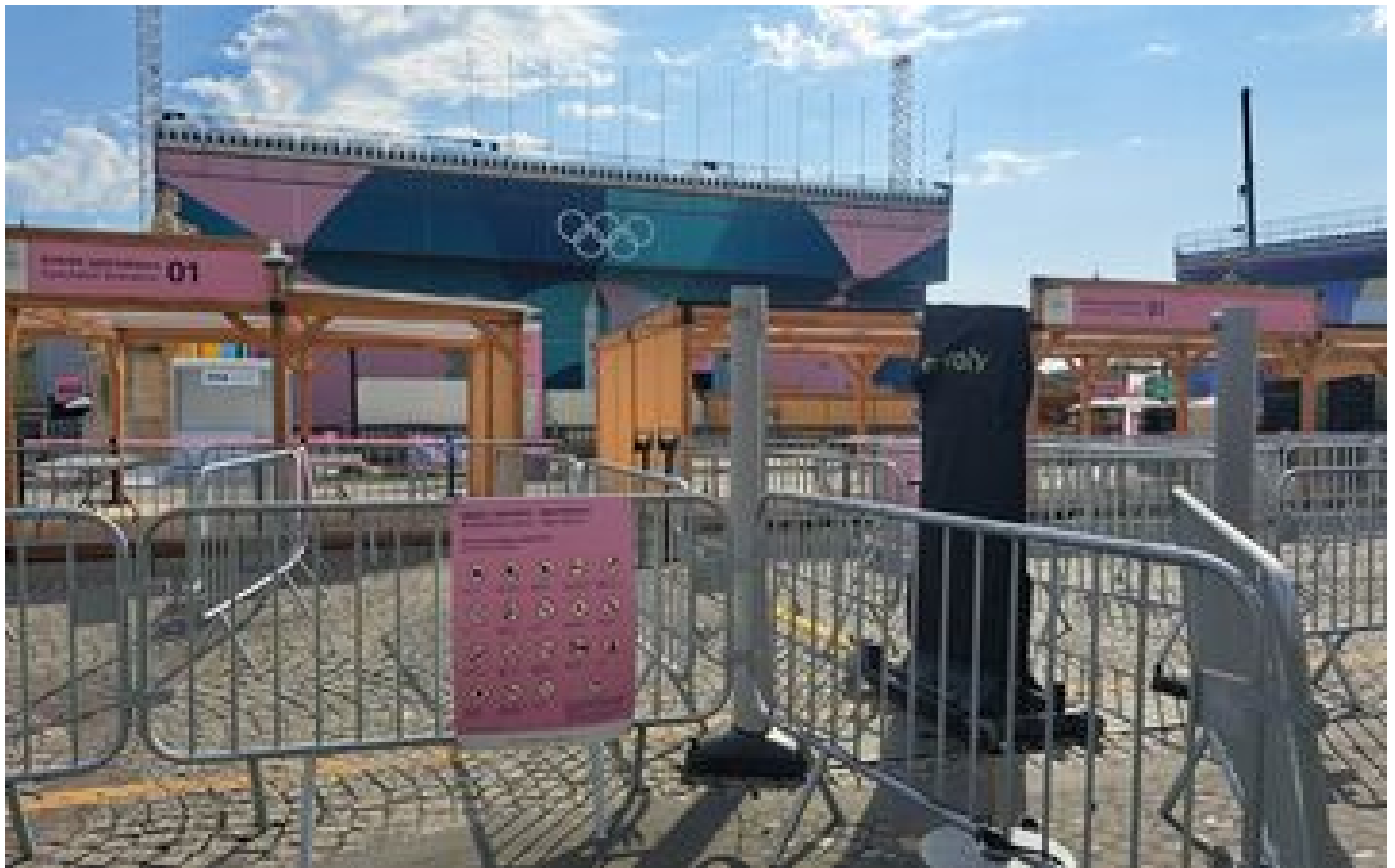
Cérémonie d'ouverture des Jeux paralympiques à Paris : voiture, piétons, vélo... la carte des périmètres de sécurité