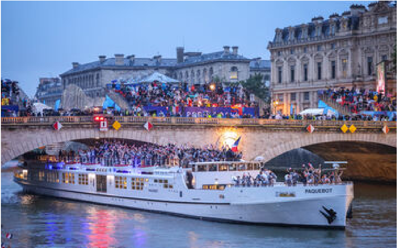
Cérémonie d'ouverture des JO 2024 : l'organisation présente ses excuses « si des gens ont été offensés »