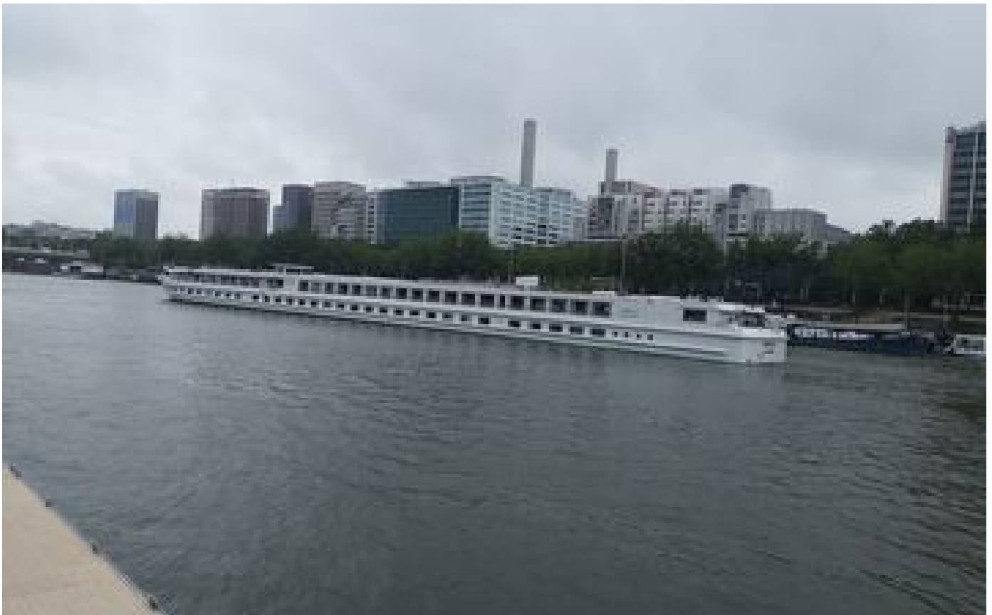
JO Paris 2024 : sur la Seine, la navigation fluviale perturbée « quasiment tous les jours » P