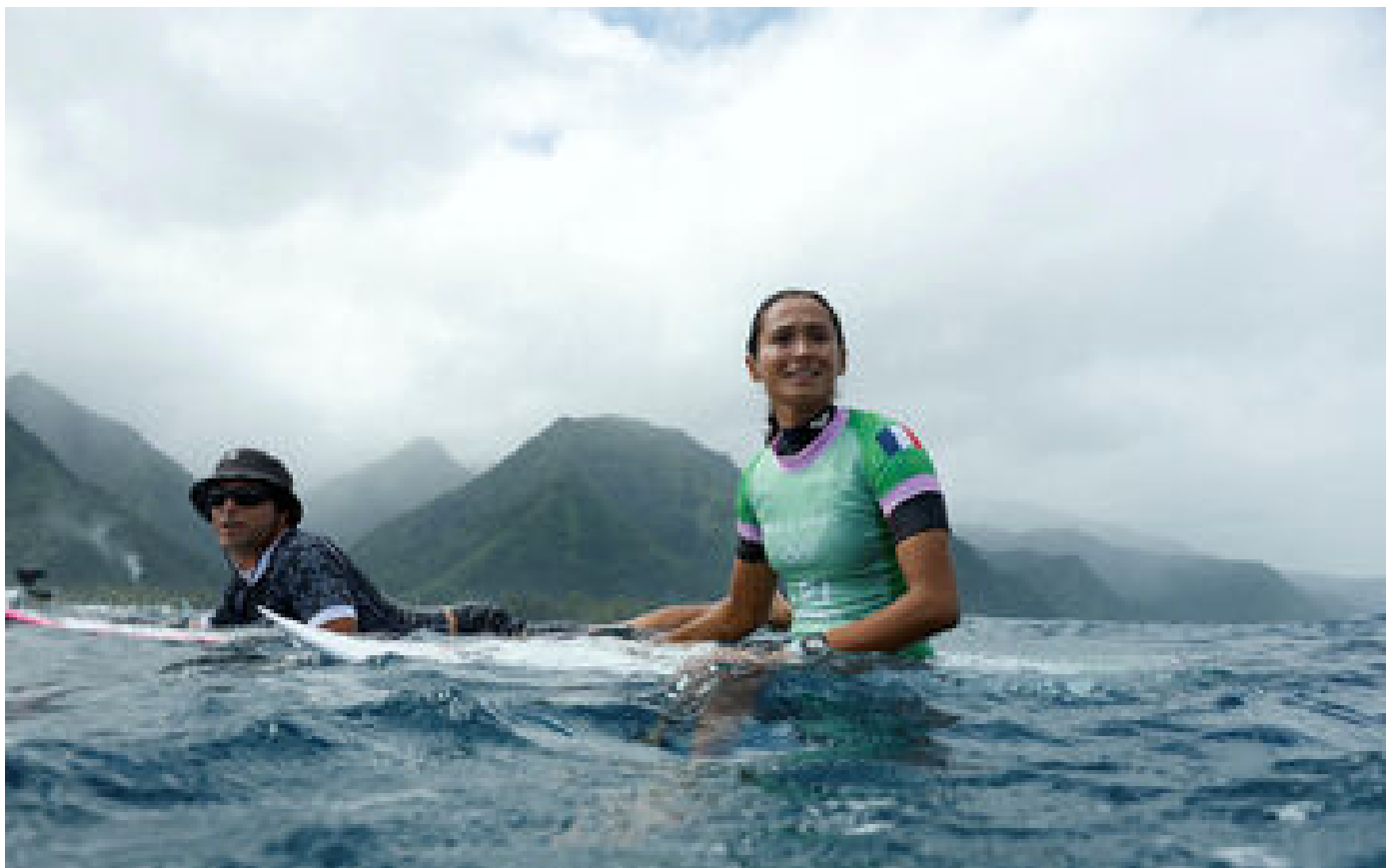
« C'est mon moment préféré » : à Tahiti, premières vagues et fortes émotions pour le surf aux JO P