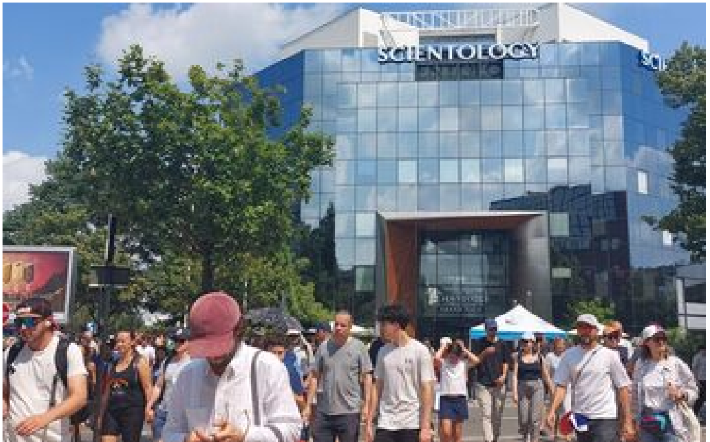
JO 2024 : livrets contre la drogue, portes ouvertes à Saint-Denis... l'Église de Scientologie plus visible que jamais P