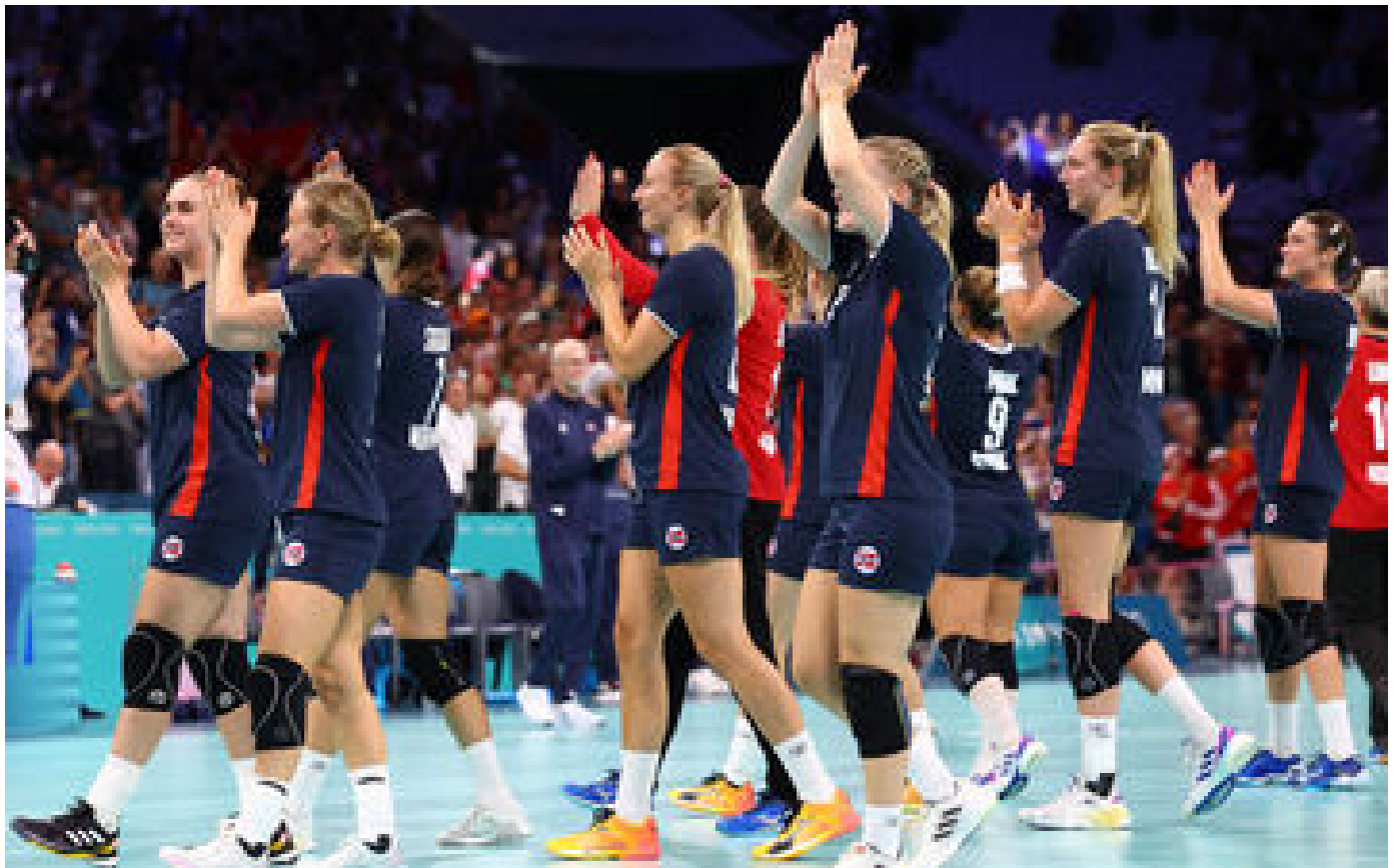
JO Paris 2024 : les Bleues affronteront la Norvège en finale du tournoi de handball