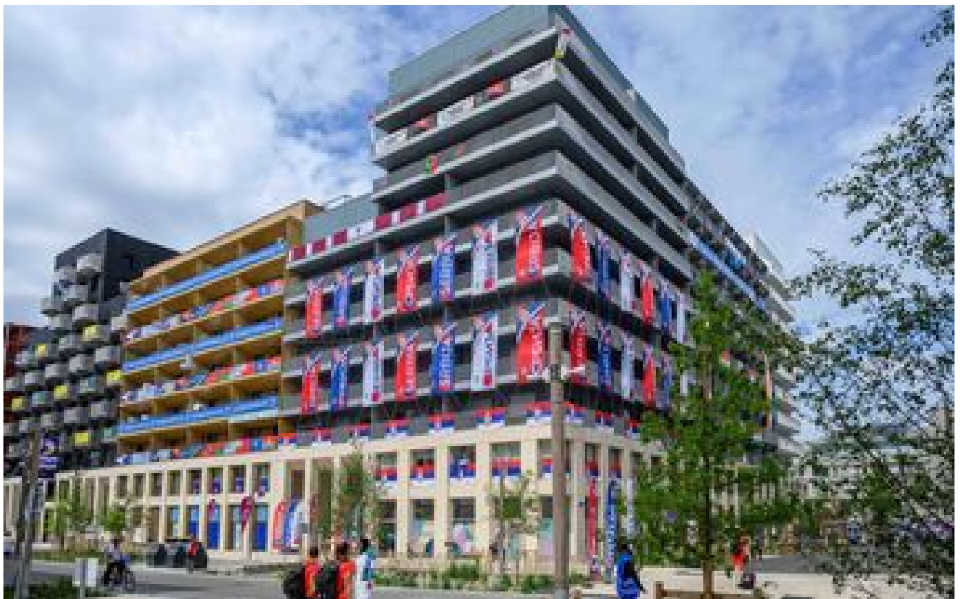
JO Paris 2024 : entre grand vide et impatience... au village olympique, drôle de chassé-croisé chez les Bleus P