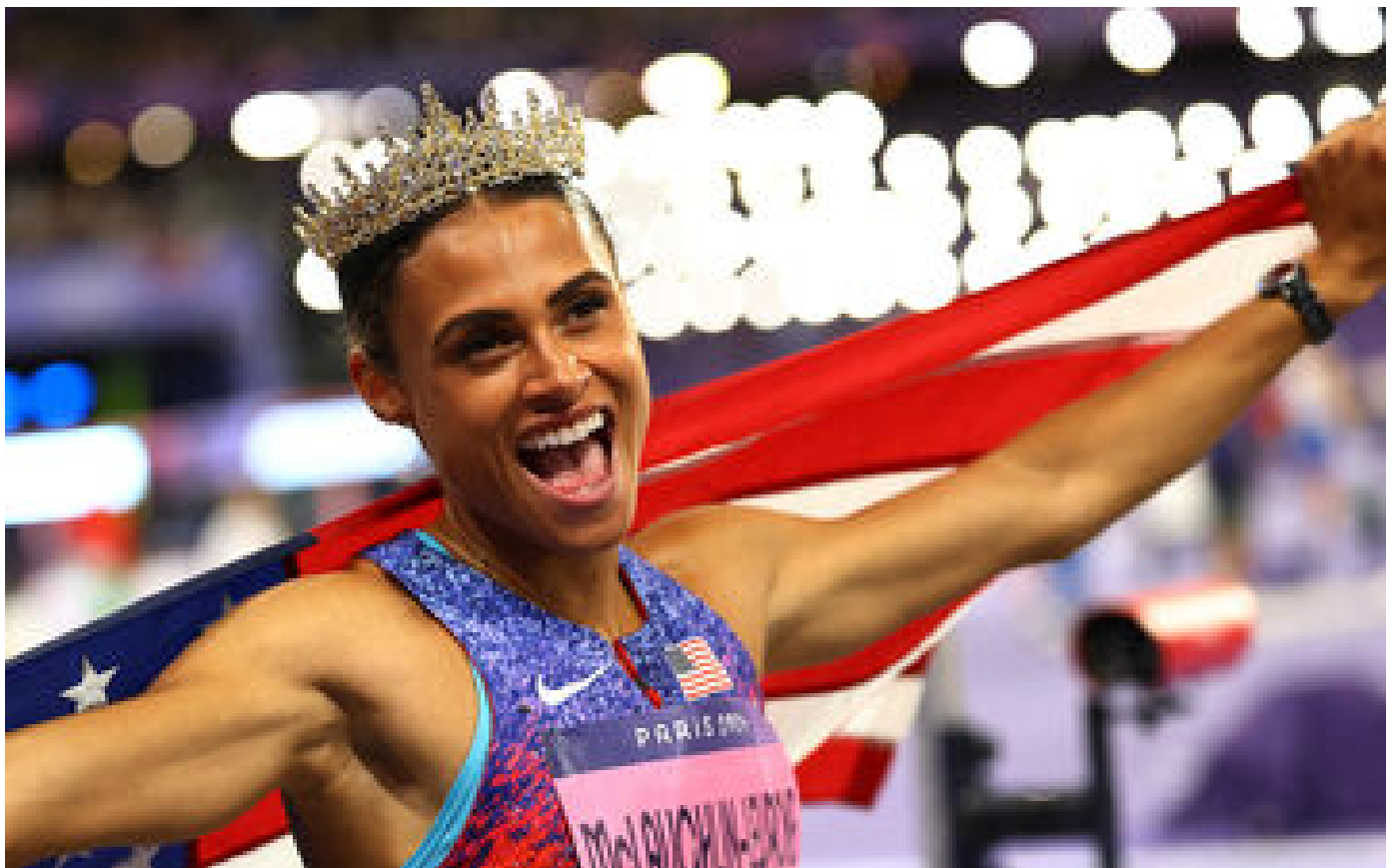
« Hyperforte, tout simplement » : Sidney McLaughlin-Levrone, la fusée du 400 m haies