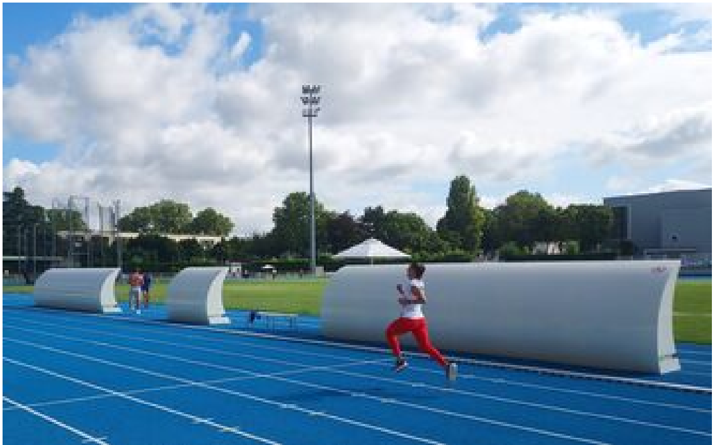
JO Paris 2024 : à Saint-Denis, au cœur du « plus gros site d'entraînement » des Jeux P