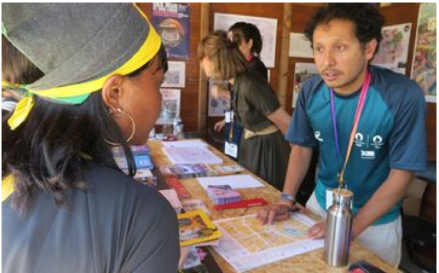
« Comment on va à la cathédrale ? » : avec les pros du tourisme à la sortie du Stade de France, à Saint-Denis P