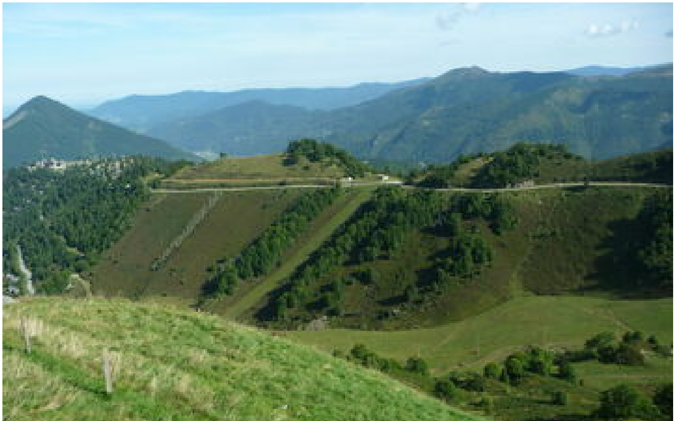
« Au secours, je suis tombé » : un randonneur britannique recherché depuis trois jours dans les Pyrénées