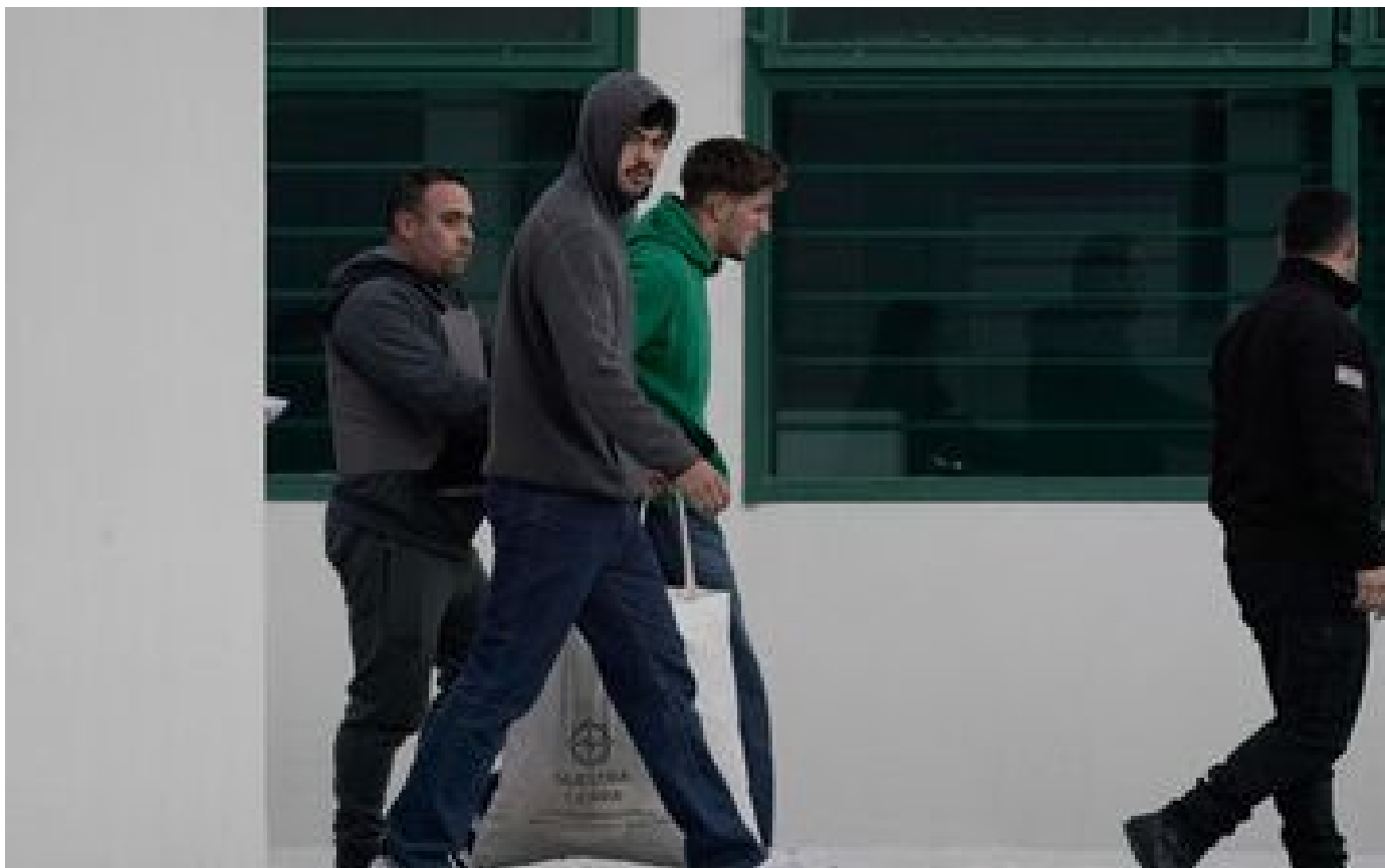
Affaire Jegou-Auradou : le père de la plaignante « veut que le rugby français sorte ces deux pourries »