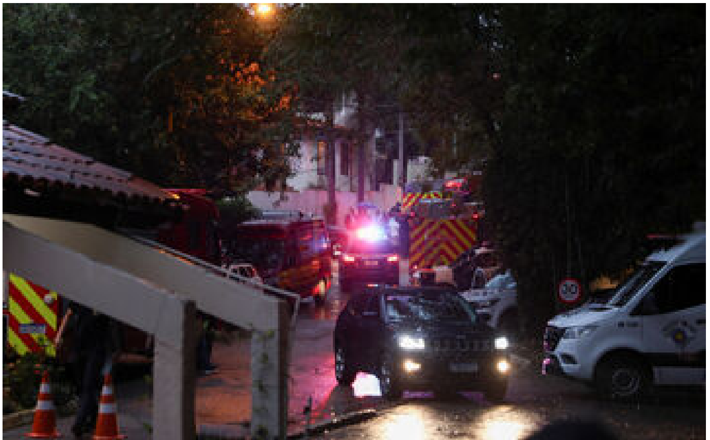
Causes, victimes... Ce que l'on sait du crash d'avion qui a coûté la vie à 61 personnes au Brésil