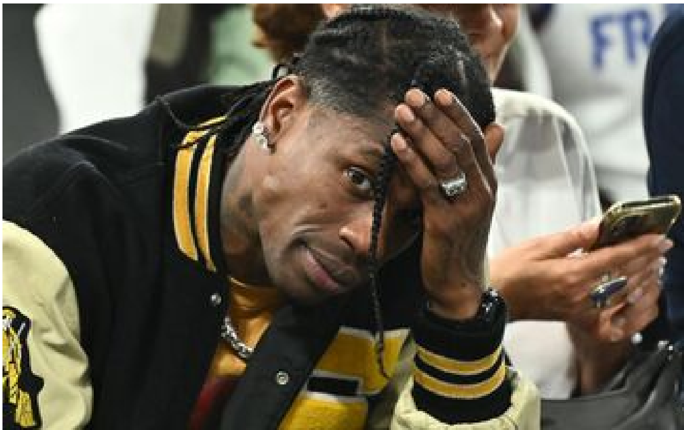
Travis Scott : deuxième jour en garde à vue à Paris pour la mégastar du rap américain