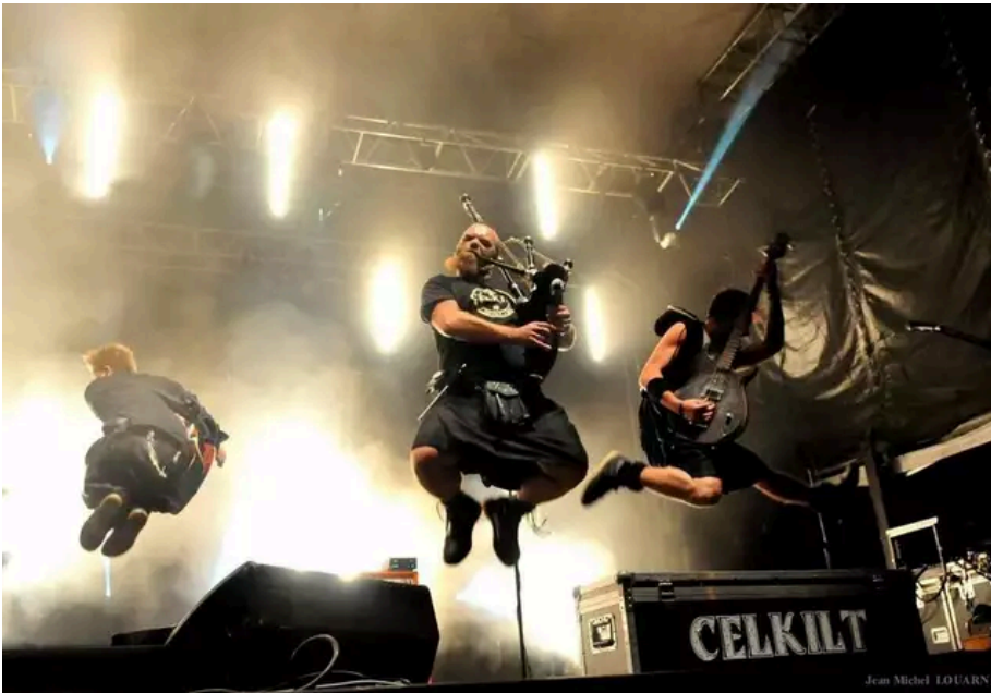
Les très bondissants Celkilt, revisitent sans freins la culture celtique.

Autre groupe présent : le Beat Bouet Trio, trois garçons dans le vent du hip-hop et de la musique bretonne à danser. Et que dire des fous furieux de Celkilt capables d'électrifier le Hellfest, s'autorisant des mix explosifs entre trad et rock sous influences Foo Fighters. Quant à Forj, ils sont les forgerons d'une transe de musiques populaires héritées du passé connectée à l'énergie électro des dance floors européens.