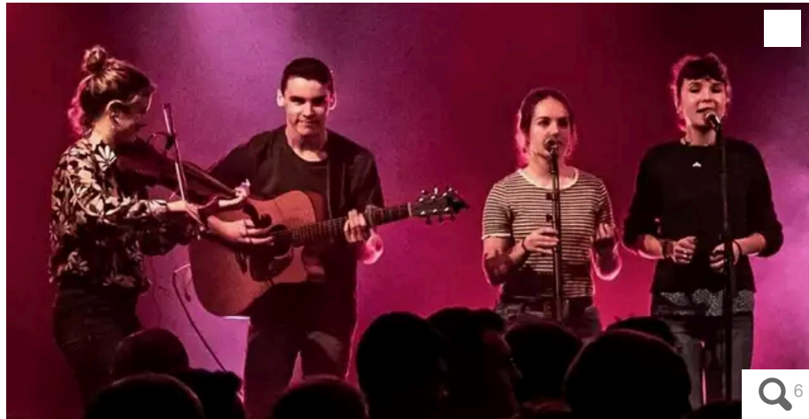
Les Bretons de Digabestr font partie des coups de cœur du patron du FiL, Jean-Philippe Mauras, pour une édition 2024 consacrée à la jeunesse celte.