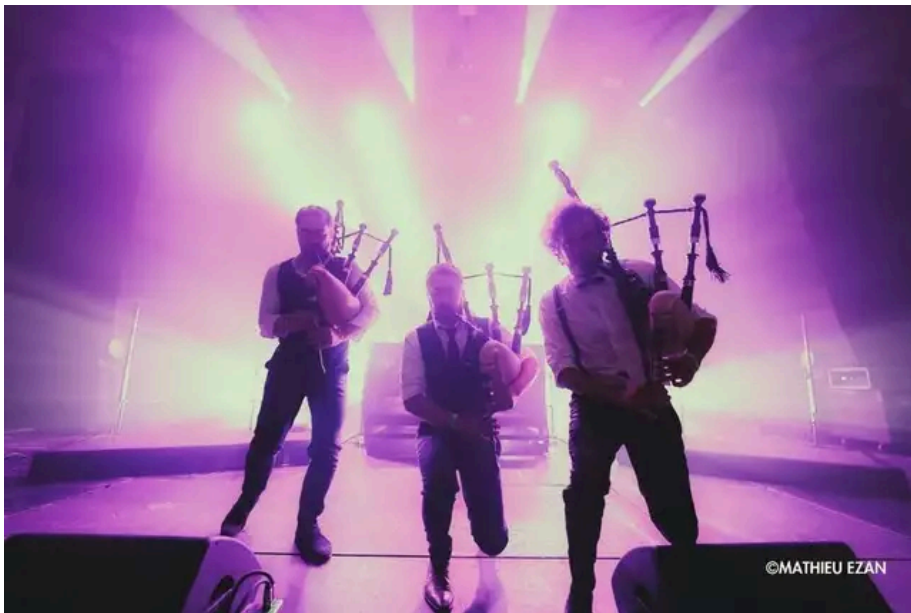
Le trio Noon marie à volonté cornemuses et électro. Mathieu Ezan