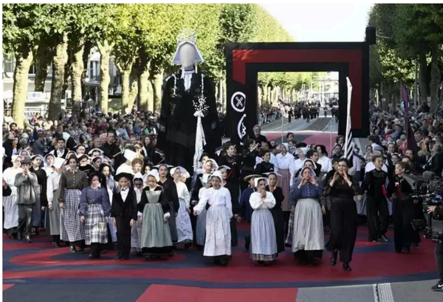
Une autre facette de la jeunesse des pays celtiques, avec la fédération Kenleur qui réunira des enfants de toute la Bretagne le jeudi 15 août pour la Grande Parade des nations celtiques.

Ajoutons-y l' Interceltic Music Camp , première résidence du genre sur le FiL, qui réunit seize filles et gars de 18 à 25 ans, issus de huit nations celtiques. De places en terrasses, leurs créations sonores feront, chaque jour, le bonheur des festivaliers.