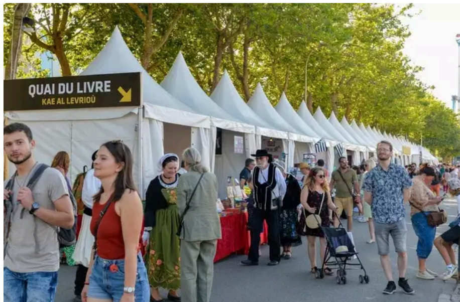
Le quai du livre a aussi ouvert quai de Rohan.

Au stand du livre, on se plaint moins de la plus faible affluence cet après-midi : « Les gens prennent le temps, c'est chouette , se réjouit Guénaëlle, auteure des éditions La Nouvelle Bleue , en dédicace. Ils sont moins pressés par la foule, plus détendus. » La foule devrait affluer dès dimanche avant l'ouverture officielle du Festival et l'ouverture des barrières encore debout dans le centre-ville de Lorient.