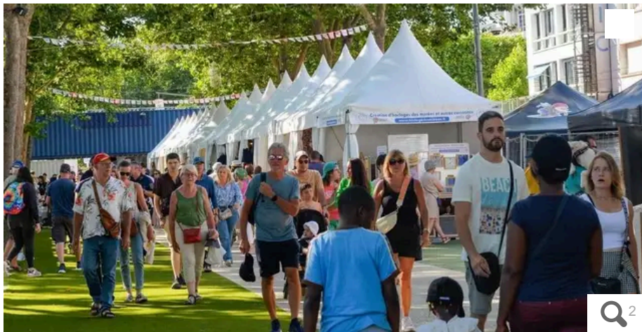
Le marché interceltique ouvrait ce samedi 10 août 2024.

Votre e-mail, avec votre consentement, est utilisé par la société Additi Multimedia pour recevoir les newsletters sélectionnées. En savoir plus