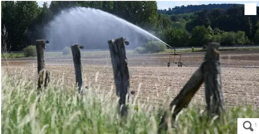
La sécheresse et le manque d'eau comptent parmi les principales inquiétudes des agriculteurs.

Votre e-mail, avec votre consentement, est utilisé par la société Additi Multimedia pour recevoir les newsletters sélectionnées. En savoir plus