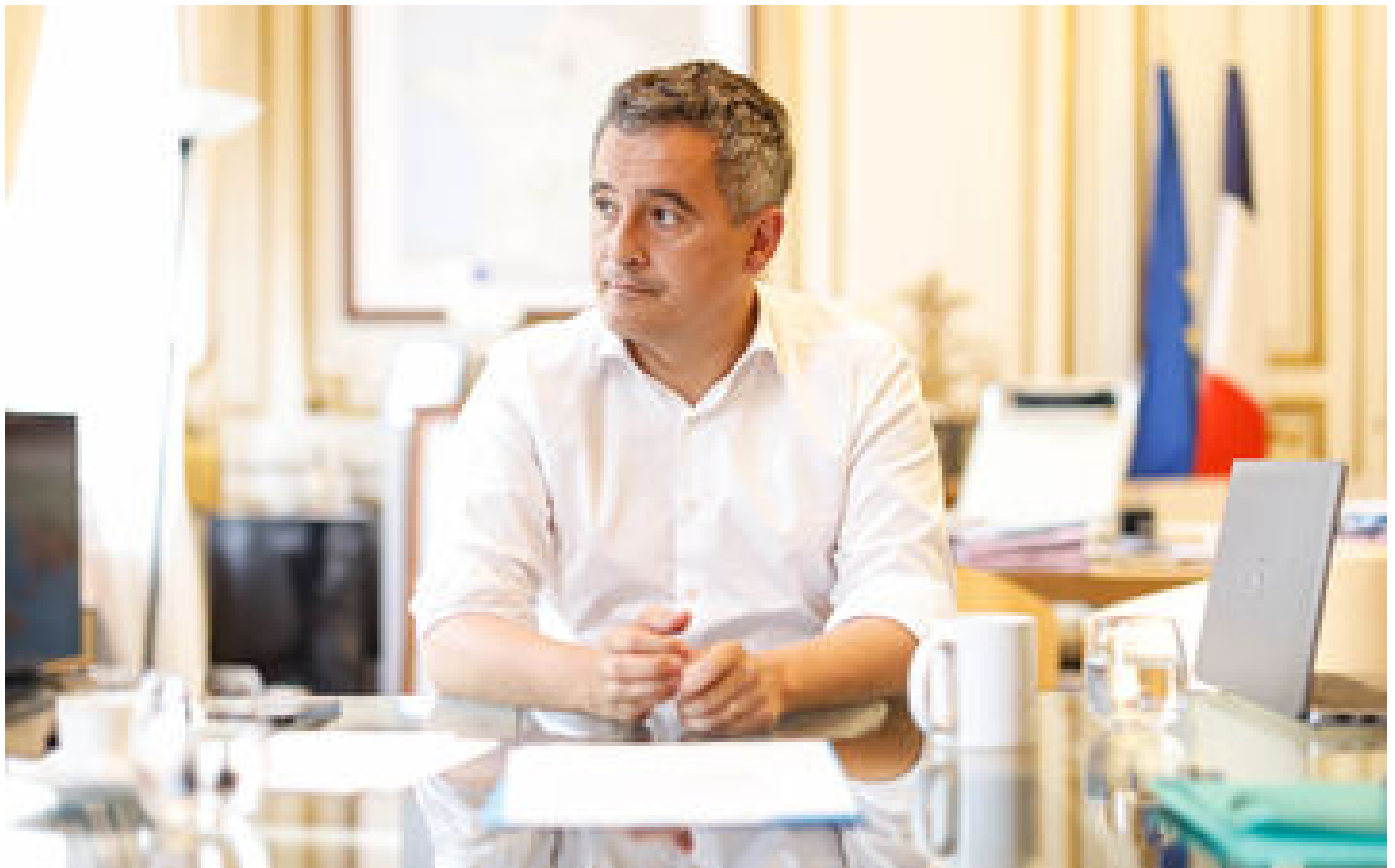
Fête de l'Assomption : les préfets et forces de l'ordre appelés à une « extrême vigilance » par Darmaprou