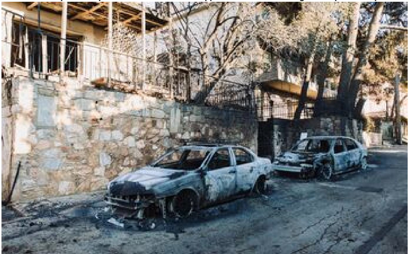
En Grèce, amertume et colère après les flammes : « C'est un miracle qu'il n'y ait pas eu plus de victimes