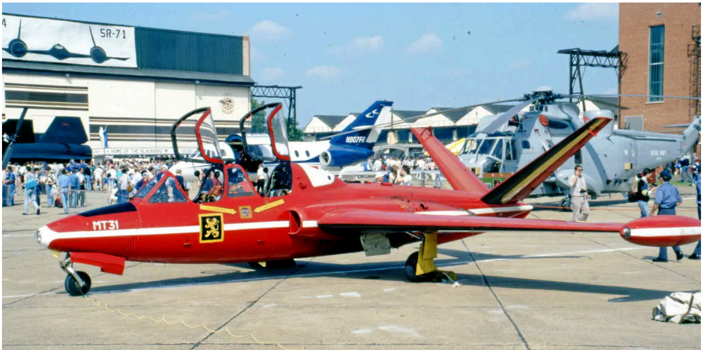
Un avion civil modèle Fouga Magister. (Image d'illustration.)

Publié le 16/08/2024 à 18h56, mis à jour le 16/08/2024 à 19h29