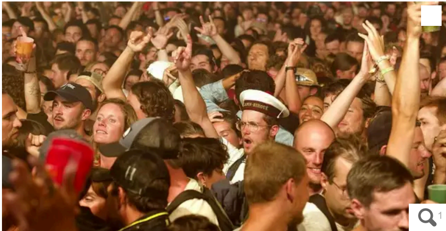
Le Kleub (ici pendant Noon vendredi soir) a rarement désempli. 3 500 personnes et du monde à l'extérieur qui n'a pas pu rentrer !

Votre e-mail, avec votre consentement, est utilisé par la société Additi Multimedia pour recevoir les newsletters sélectionnées. En savoir plus