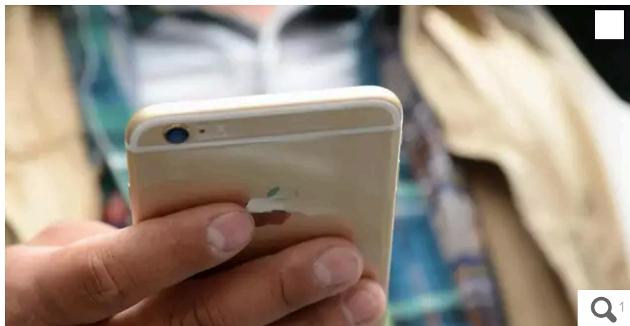
Le prévenu a aussi mis le feu à la sonnette de la victime.