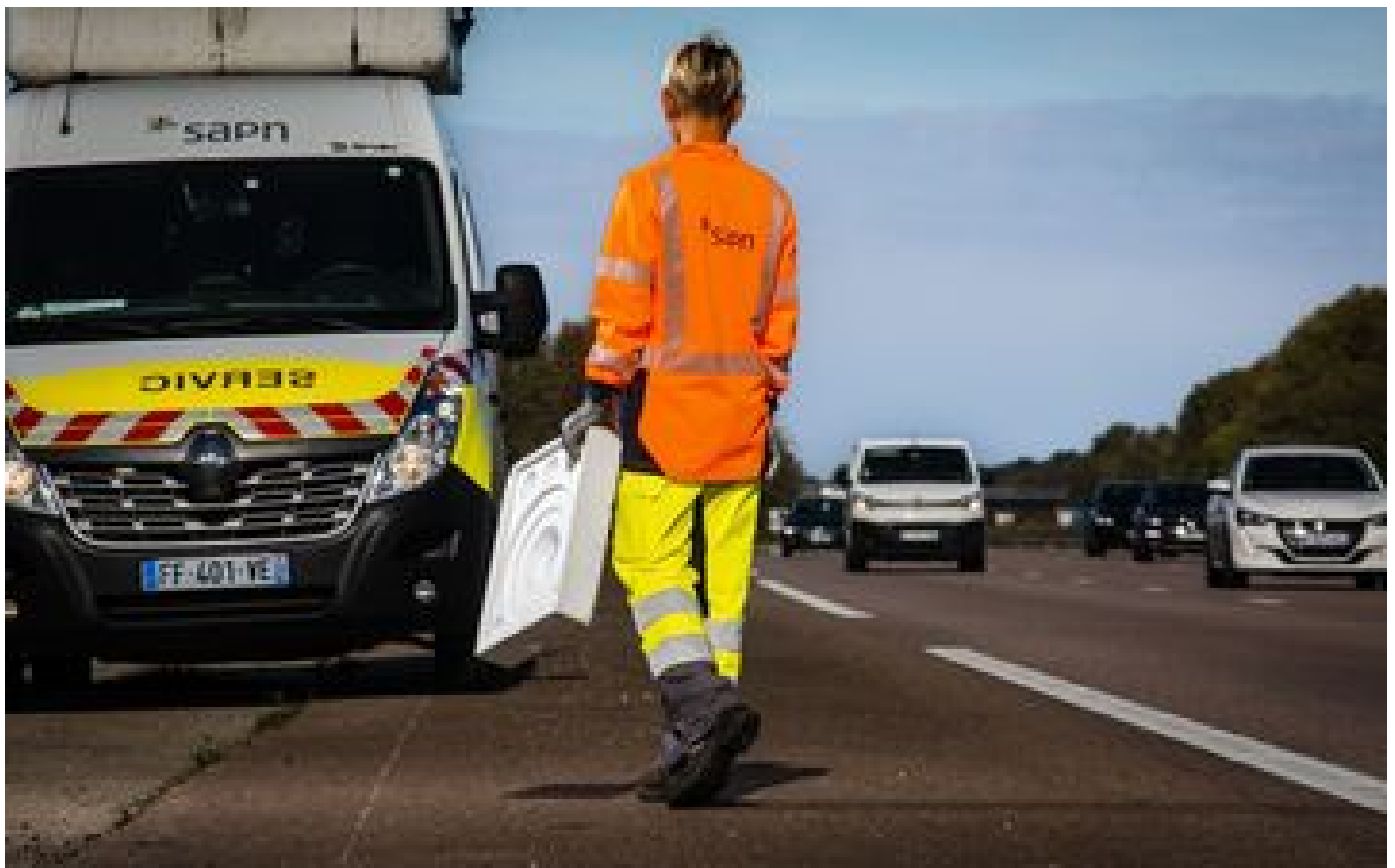
Autoroute Paris-Normandie : voici «les secteurs les plus accidentogènes» de l'A13