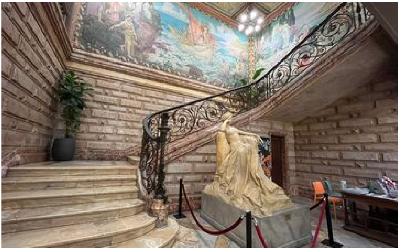
Pyrénées-Orientales : quand JOB transformait le papier à cigarette en châteaux