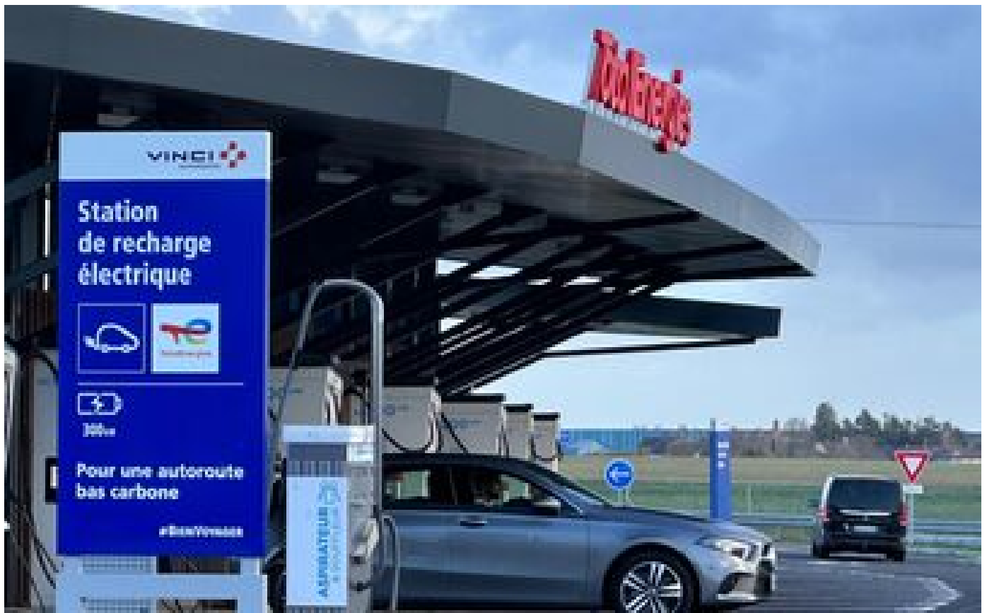
Voiture électrique : les autoroutes disposent d'assez de bornes de recharge... pour l'instant P