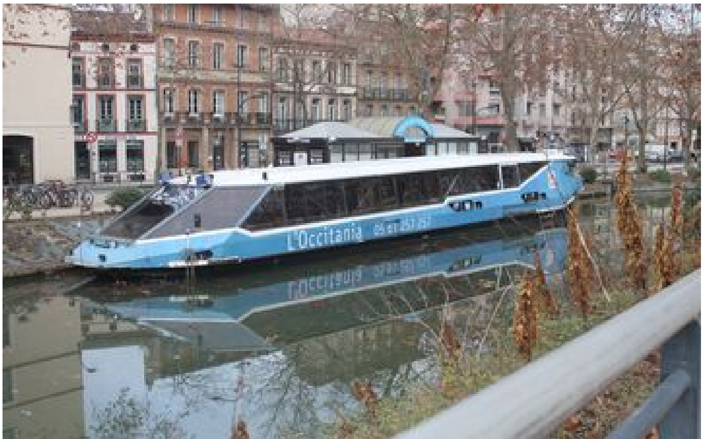
Emblématique du canal du Midi, le bateau-restaurant l'Occitania est à vendre