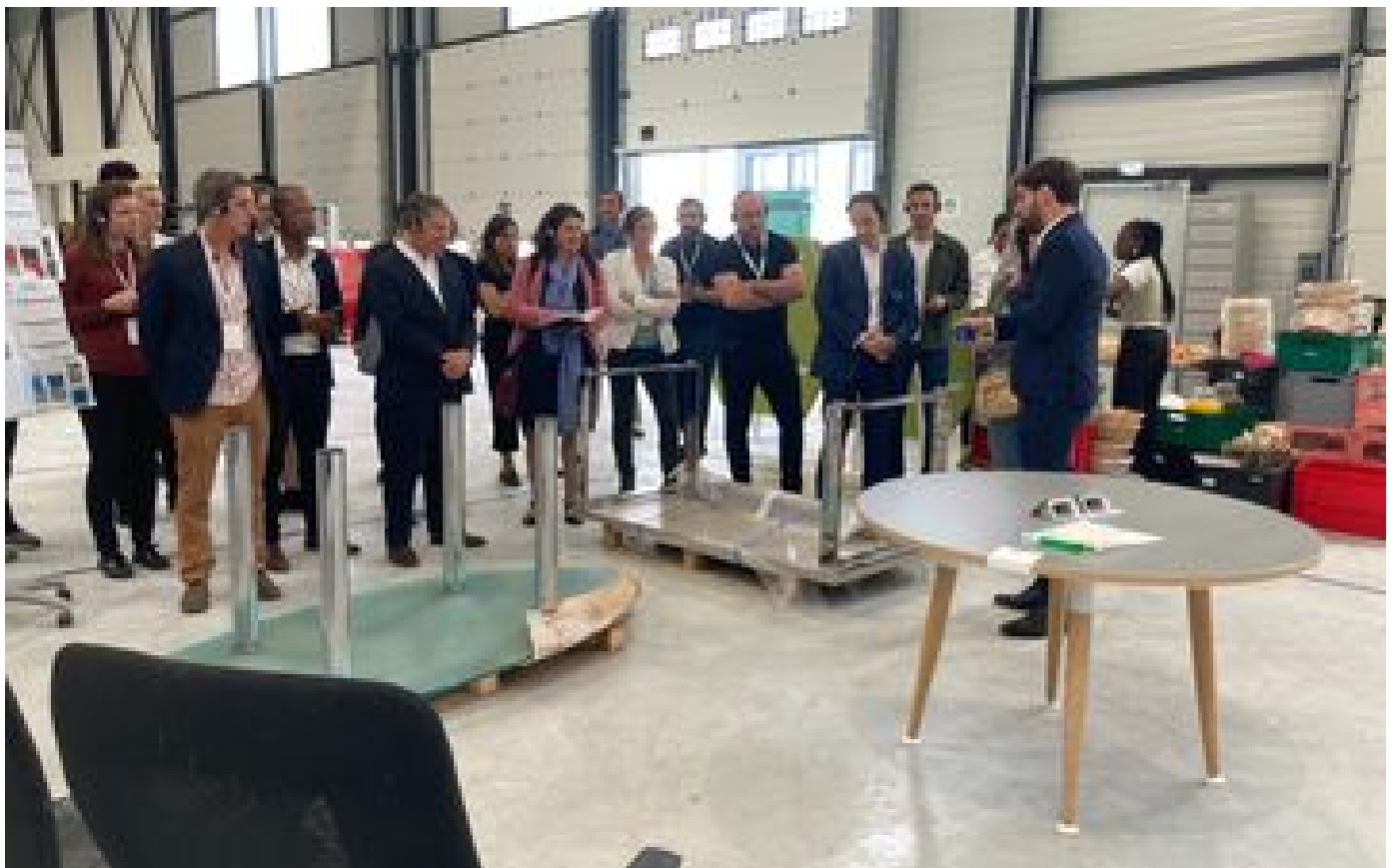
C'est une première : Manutan, spécialiste du mobilier de bureau, se lance sur le marché de la seconde main P