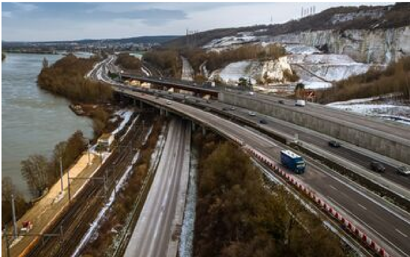
Neige, verglas, trafic... Vigilance accrue sur l'A13 entre Paris et la Normandie pour les fêtes P