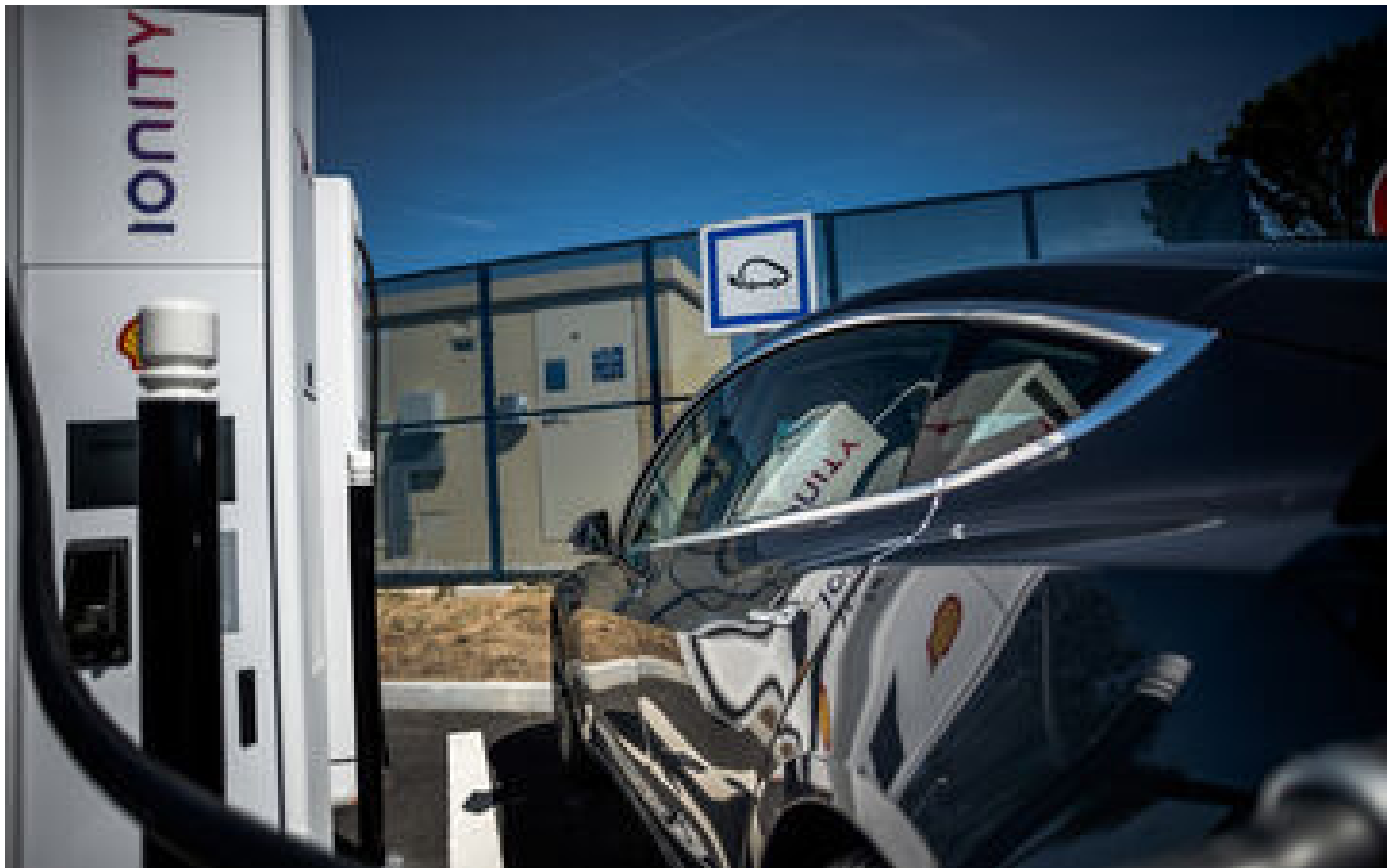
Recharge des voitures électriques : le nouveau pactole des sociétés d'autoroute P