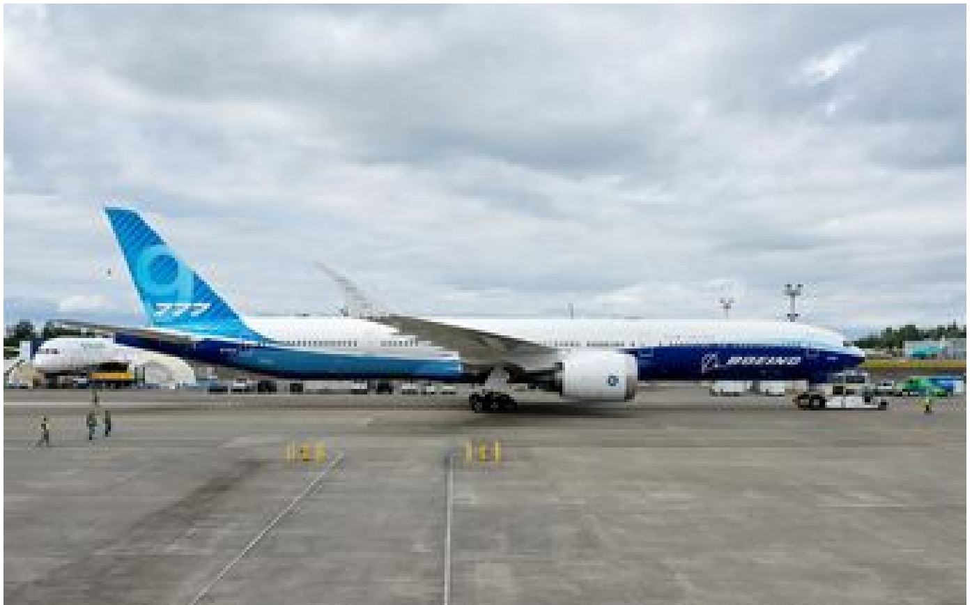
Boeing suspend les vols tests du 777X après la défaillance d'une pièce