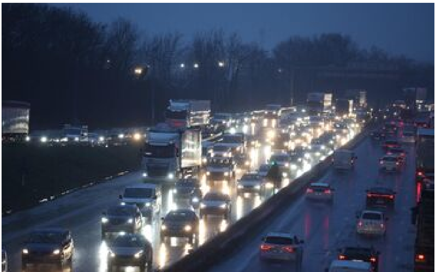
Neige et verglas : sur l'A13, une nuit sous haute surveillance près de Paris