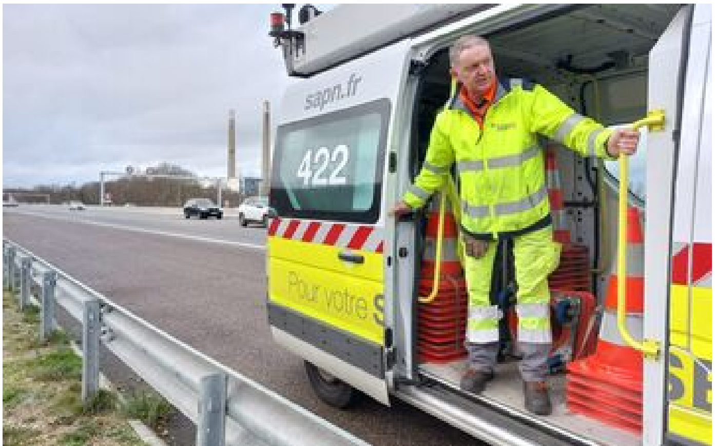
Sécurité : avant le Réveillon, les agents de l'autoroute A13 sur la brèche entre Paris et la Normandie