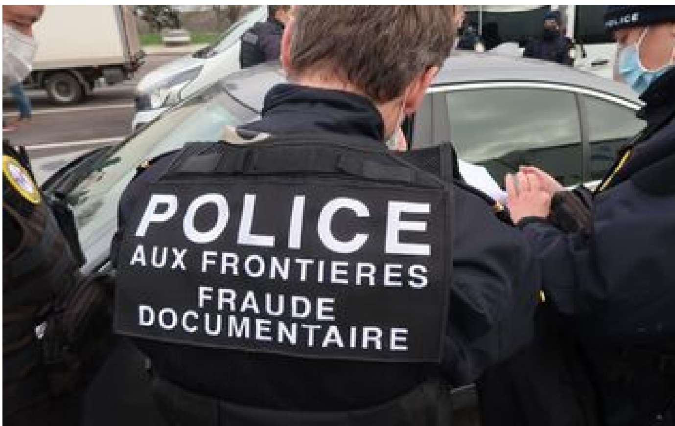
Sur l'A13, une opération commando contre le travail clandestin : «Notre objectif, démanteler des filières» P