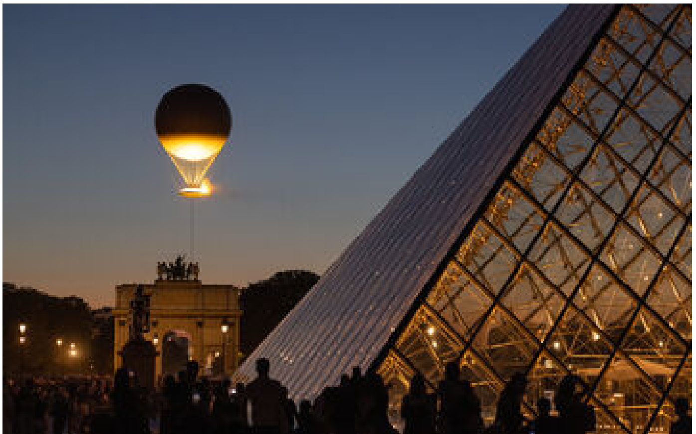
Flamme des Jeux paralympiques Paris 2024 : dates, parcours, porteurs... Où et quand voir le relais en France ?