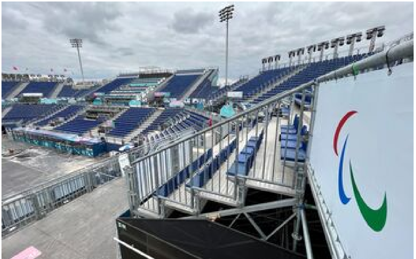
Jeux paralympiques Paris 2024 : 1,75 million de billets vendus, dont 700 000 depuis le début des JO