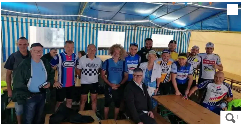
La joyeuse équipe de la Vintage.

Votre e-mail, avec votre consentement, est utilisé par la société Additi Multimedia pour recevoir les newsletters sélectionnées. En savoir plus