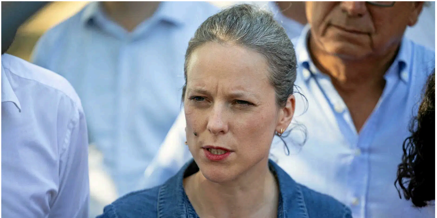
Lucie Castets à Châteauneuf-sur-Isère, dans la Drôme, le 24 août 2024.